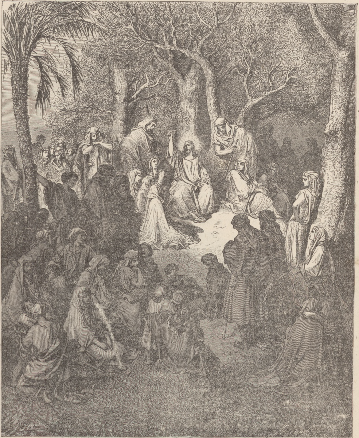
KAZANIE P. JEZUSA NA GÓRZE