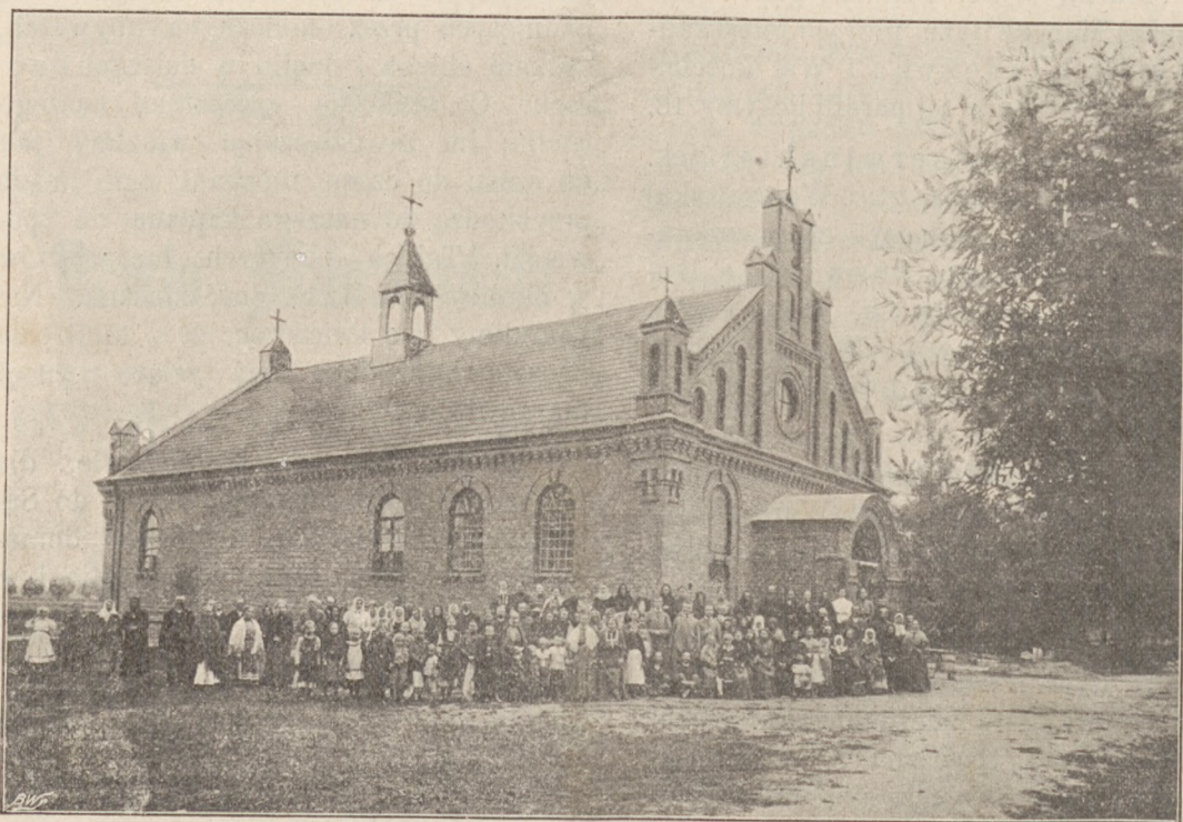
Kościół Maryawicki w Radzyminku (par. Radzymin.)

do chorego, prześladowanie służby dworskiej, denuncyacje, — wszystko to były i są środki zalecane wiernym katolikom i aprobowane przez katolickie duchowieństwo w walce z Maryawityzmem. 1) Atoli broń tego rodzaju, jako objaw wstecznictwa i zwyrodnienia, nie mogła powstrzymać porywów ludu do czystych ideałów Chrystusowej nauki, nie była już w stanie skrepować ducha, który rozbudzony z uspienia rwał się do światła, do życia wolnych Synów Bożych. Maryawi-