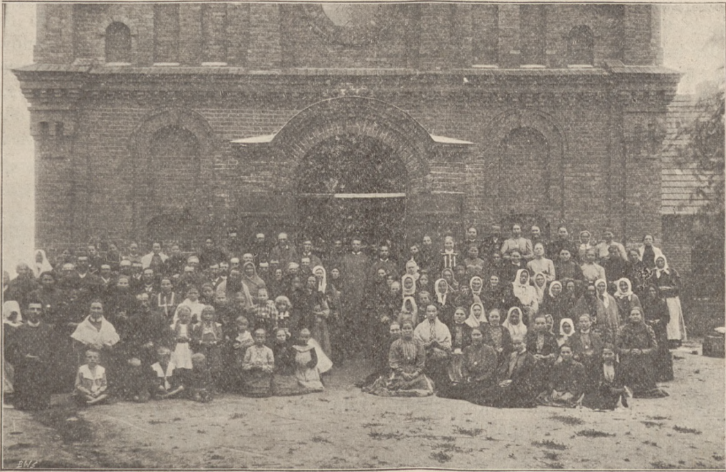
Grupa parafian Radzyńskich.

pokalanego Poczęcia Najświętszej Maryi Panny dokonano poświęcenia nowej świątyni i przeniesiono do niej z prowizorycznej kaplicy Przenajświętszy Sakrament oraz nabożeństwo kościelne. Przy kościele, według zwyczaju Maryawickie-