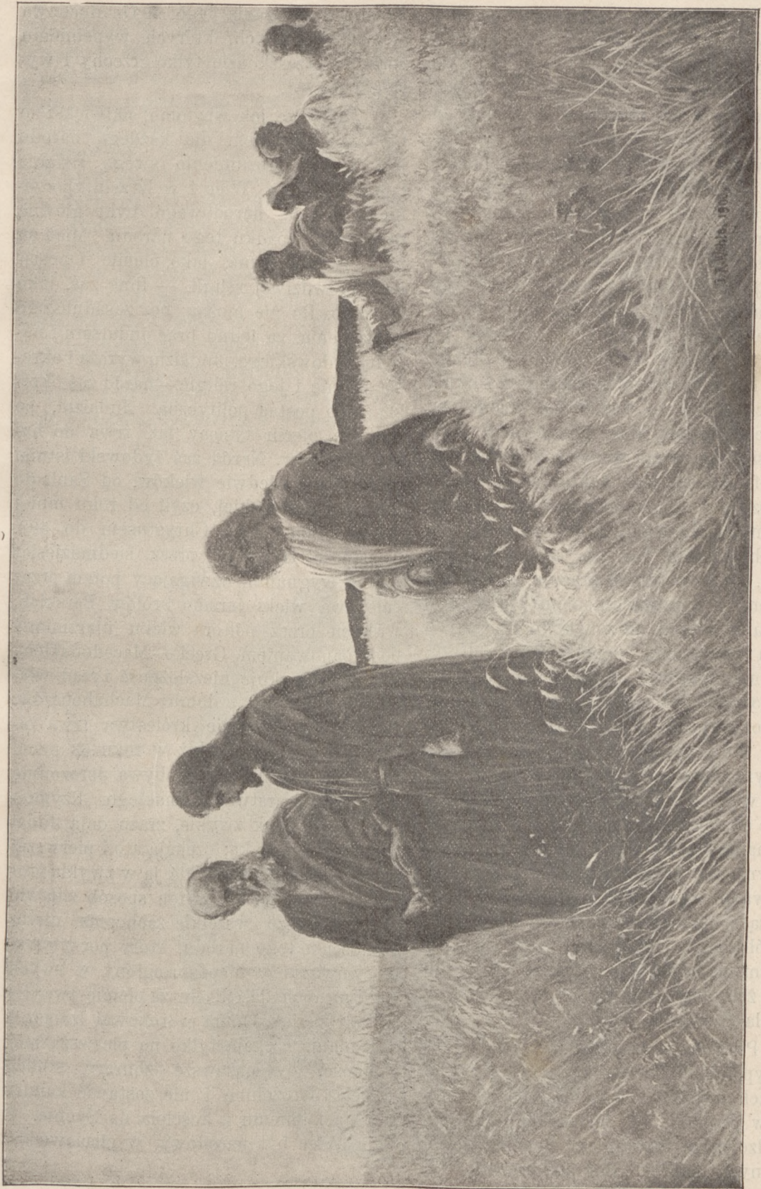
APOSTOŁOWIE ZRYWAJĄCY KŁOSY.