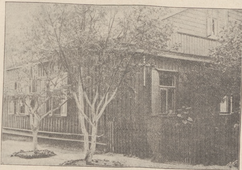
Kaplica Maryawicka w Kownie.

Maryawityzm na Litwie szerzy się coraz więcej. W Kownie mieszka stale kapłan Maryawita. Przy ul. Mickiewicza wynajęto dom i urządzono w nim kaplicę: Obecnie maryawici kowieńscy zamierzają budować własną świątynię.