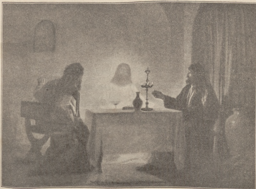
PIELGRZYMI Z EMAUS.

Obraz, którego reprodukcję podajemy, należy do nowszej szkoły. Autorem jego jest E. Girardet. Artysta uchwycił tę chwilę, kiedy Pan Jezus dał się poznać uczniom i „zniknął z oczu ich.“ (Łuk. 24, 31).