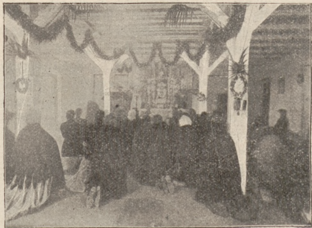
Wnętrze kaplicy na Pradze.

„Radość maryawitów była nieopisa- „na. Postanowiono natychmiast skorzy-