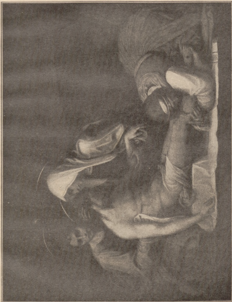
ZDJĘCIE Z KRZYŻA.