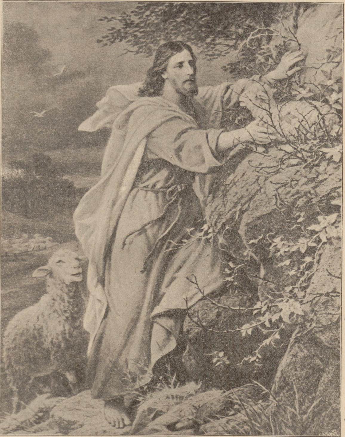
JAM JEST PASTERZ DOBRY. (Jan X, 11).