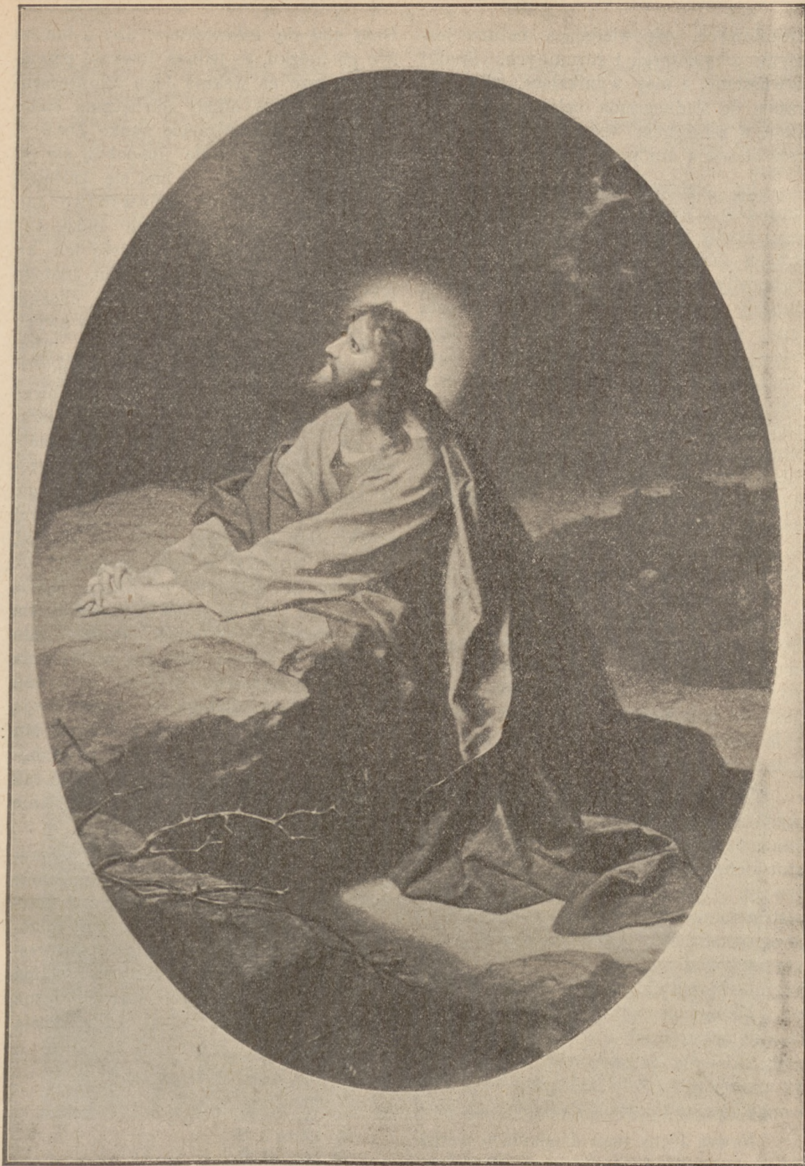
MODLITWA PANA JEZUSA W OGRÓJCU.