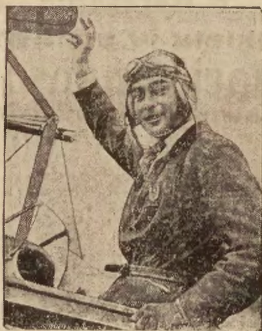
Słynny lotnik rumuński, książę Chica, w czasie lotu z Londynu do Stambułu uległ nieszczęśliwemu wypadkowi i poniósł śmierć. Ks. Chica był osobistym przyjacielem króla Karola.