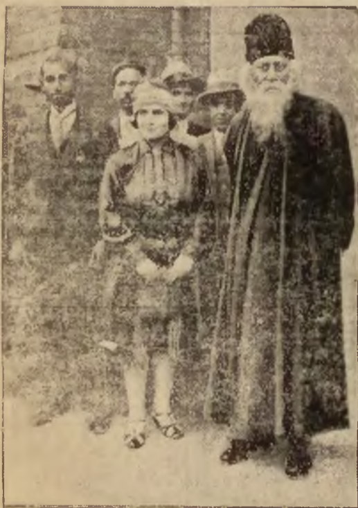
bawił temi dniami w Londynie, jako gość Międzynarodowego Stowarzyszenia studentów. W berlińskim uniwersytecie wygłosił odczyt p. t. „Zasady sztuki”. Na odczyt tym po raz pierwszy zademonstrował wielki pisarz idyjski swoje rysunki i obrazy, o których istnieniu dotychczas nie wiedziano.

REDAKCJA: Warszawa. Nowy Świat 22. Telefony: Redakcji 91-60, 91-25. Drukarni 91-62 (dod.). Red. Naczelny 91-62. Sekretarz redakcji przyjmuje interesantów codziennie z wyjątkiem niedziel i świąt w godz. 19-20 (tel. 91-60). ADMINISTRACJA: Warszawa, Zgoda 1. Telefony: Dyrekcja 91-66. Zarząd 91-66 (dodatkowy). Wydział Ogłoszeń: 91-56. Dział kolportażu 91-56 (dodatkowy). Skrzynka pocztowa 745. Adres telegraficzny — ABC Warszawa. Konto czekowe P. K. O. Nr. 13550. PRZEDSTAWICIELSTWA: Lublin, Plac Litewski 1, tel. 243; Kalisz, Aleja Józefiny 4, tel. 209; Koło, 3-go Maja 1; Piotrków Trybunalski, Słowackiego 9, tel. 59; Poznań, Murna 2, tel. 39-18; Suwalski, Kościuszki 81, tel. 68; Włocławek, Cyganka 26, tel. 136. PRENUMERATA: miejscowa (z odnoszeniem do domu) i zamiejscowa — zł. 4.50 miesięcznie. Konto czekowy P. K. O. Nr. 13550.