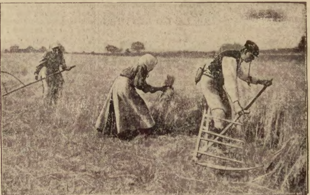
Tegoroczne upały przyspieszyły dojrzewanie zboża. W całej Polsce odbywają się już obecnie żniwa.