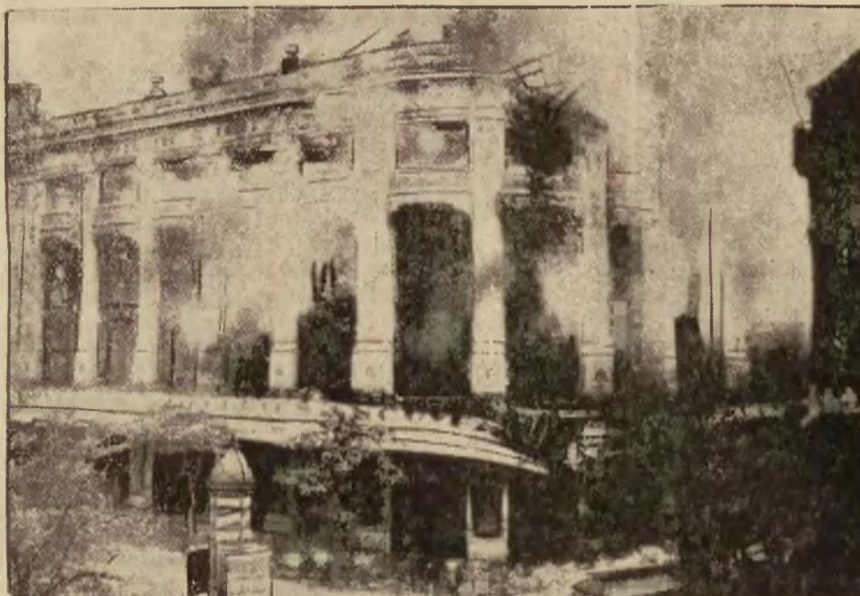
Przed kilku dniami sponął w Paryżu olbrzymi gmach magazynu „Galeries Nouvelles”. Straty wynoszą od 30 do 40 milionów franków. Ilustracja nasza przedstawia szczytu wy moment pożaru. Zdjęcie zostało dokonane w nocy, a jego wyrazistość jest najlepszym dowodem, jak silną była luna, wywołana przez pożar.