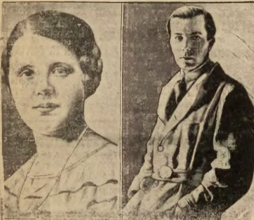
Królowa Holandji udaje się w najbliższym czasie z córką do Skandynawji. Podróż ta ma podobno na celu zaręczyny holenderskiej następczyni tronu z drugim synem szwedzkiego następcy tronu. Na ilustracji księżniczka holenderska Julja i książę szwedzki Sigwart.