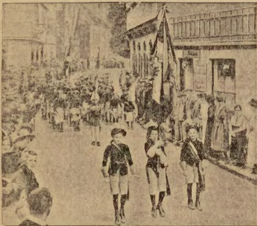
W miejscowości Bieberich nad Renem odbywa się co roku pochód młodzieży szkolnej w malowniczych kostiumach, wyobrażających różne epoki.