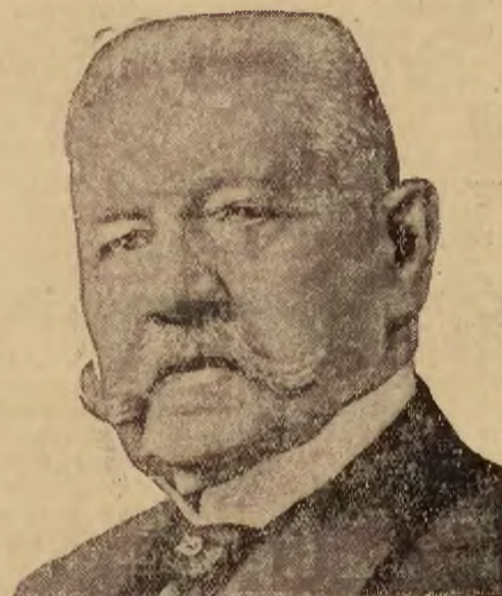
udaje się w najbliższych dniach w podróż propagandową do Nadrenji, opuszczonej świeżo przez wojska okupacyjne francuskie.

REDAKCJA: Warszawa, Nowy-Swiat 22. Telefony: Redakcji 91-60, 91-25. Drukarni 91-62 (dod.). Red. Naczelny 91-62. Sekretarz redakcji przyjmuje interesantów codziennie z wyjątkami niedziel i świąt w godz. 19-20 (tel. 91-60). ADMINISTRACJA: Warszawa, Zgoda 1. Telefony: Dyrekcja 91-66. Zarząd 91-65 (dodatki). Wydział Ogłoszeń: 91-56. Dział kolportażu 91-56 (dodatki). Skrytka pocztowa 745. Adres telegraficzny — ABC Warszawa. Konto czekowe P. K. O. Nr. 13550. PRZEDSTAWICIELSTWA: Lublin, Plac Litewski 1, tel. 243; Kalisz, Aleja Józefiny 4, tel. 209; Koło, 3-go Maja 1; Piotrków Trybunalski, Siewackiego 9, tel. 59; Poznań, Murna 2, tel. 39-18; Suwałki, Kosciuszki 81, tel. 68; Włocławek, Cyganka 26, tel. 136. PRENUMERATA: miejscowa (z odnośnieniem do domu) i zamiejscowa — zł. 4.50 miesięcznie. Konto czekowe P. K. O. Nr. 13550