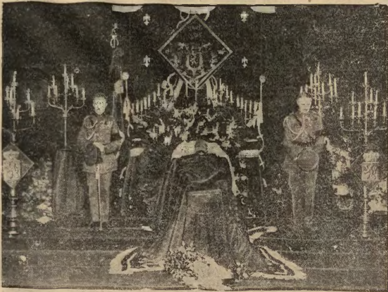
na zamku królewskim w Brukseli