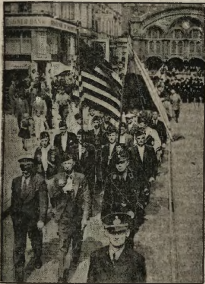
Kombatanci amerykańscy przybyli do Niemiec i urządzają koncerty w większych miastach Rzeszy. Z Niemiec kombatanci amerykańscy udają się na kongres muzyczny do Genewy.