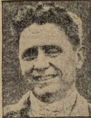
Dwaj amerykańscy lotnicy Clyde Pangborn (lewy) i Bennet Griffin zamierzają odbyć lot dookoła kuli ziemskiej w rekordowym czasie 4 i pół dnia