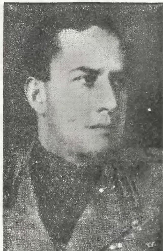
Min. spraw zagr. Italii hr. Galeazzo Ciano,