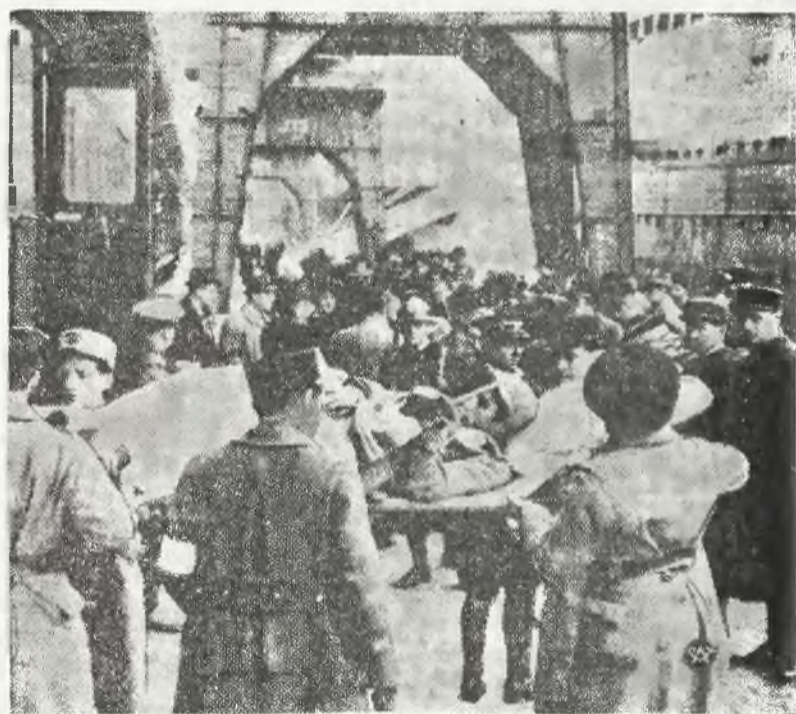
Do Marsylii przybył transport rannych żołnierzy republikańskich.