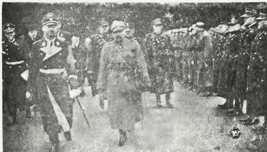
Szef policji niemieckiej Himmler w towarzystwie gen. Kordiana Zamorskiego i ambasadora von Moltke przed frontem kompanii honorowej.