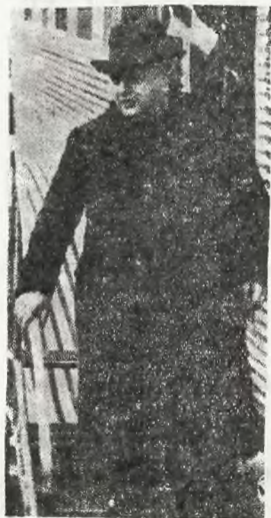
Premier niepodległej Słowacji ks. dr. Tiso

podał do wiadomości wszystkich obywateli Rzeszy proklamację Hitlera, wynik rokowań i rozkaz kanclerza do wojska.