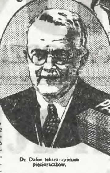
Dr. Dafoe lekarz-opsiekun pięcioraczek.

Wobec przedwczesnego urodzenia się Pięcioraczek Kanałjskich tylko olejek oliwkowy był dostatecznie łagodny dla ich skóry! Poźniej Dr. Dafoe z największą starannością wybrał dla nich mydło. Wybor jego padł na Palmolive, mydło na olejku oliwkowym! Przykład ten powinien być naśladowany przez każdą kobietę, która dba o skórę swego dziecka i własną cerę. Używaj mydła Palmolive do codziennej kąpieli.