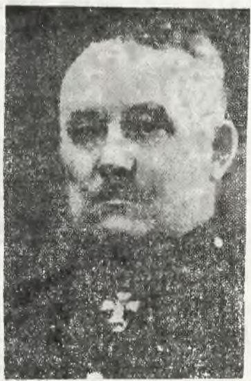
Gen. Laidoner, naczelnym wodzem armii estońskiej

W czasie raidu wydarzył się wypadek pod Otwockiem, w wyniku którego ranny został jeden z zawodników, poza tym 6 maszyn wycofano.