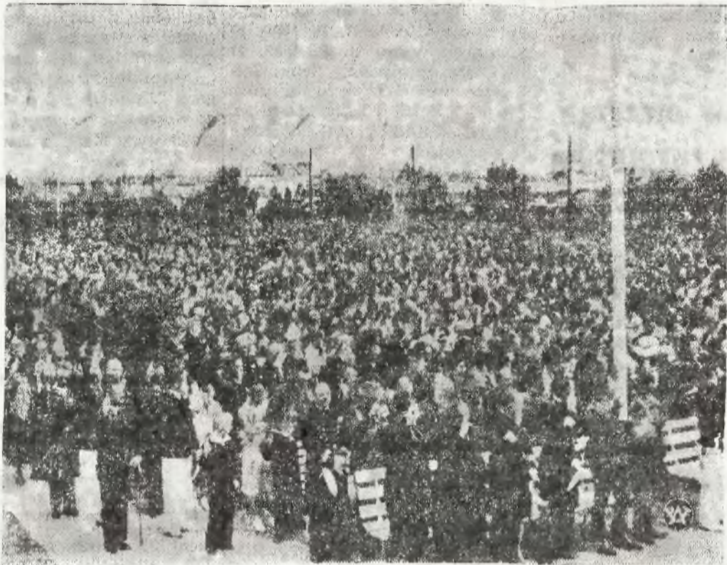
Moment uroczystej przysięgi, złożonej przez stutysięczne rzesze Polaków, obecnych na uroczystościach morskich w Gdyni. Tłumy powtarzały następującą rotę przysięgi: „Polska od Bałtyku odepchnąć się nie da, przysięgamy: odwiecznych praw Polski do Bałtyku i morskich przeznaczeń Rzeczypospolitej strzec, nad ujściem Wisły straż niezłomną trzymać, dorobek Polski na wybrzeżu i morzu stale pomnażać, braci naszych za kordonem, nierozłączną część narodu polskiego, wspomagać i bronić. Tak nam dopomóż Bóg”.