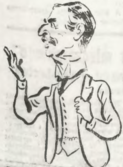
Premier Neville Chamberlain.

LONDYN, 3. 7. Ołbrzymie wrażenie wywołała tu wiadomość o nagłym wezwaniu do Londynu ambasadora brytyjskiego w Berlinie sir Nevila Hendersona. Wez-