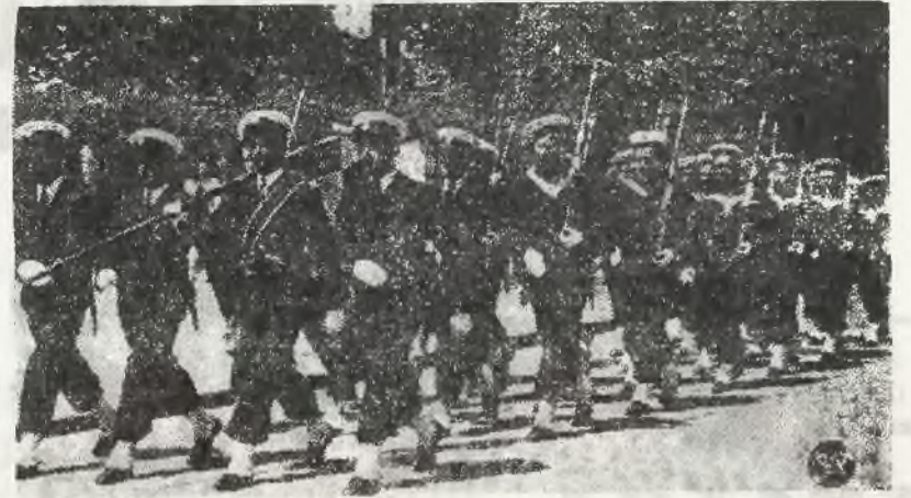
Oddział marynarzy, złożony z uczniów klas wyższych Gimnazjum i Liceum Państwowego w Zamościu podczas defilady w dniu „Święta Morza”

ZMIANA ADRESU Tow. Handl. „KUPIEC POLSKI” obecnie Marszałkowska 119 m. 5. tel. 310-11 i 354-14