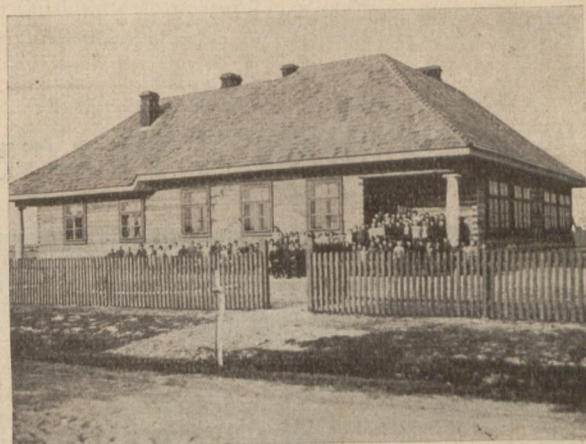
2 kl. Publ. Szkoła Powsz. w Chatuciczach, pow. mołodecki.

Z zasiłku Rządu otrzymały dotąd powiaty: