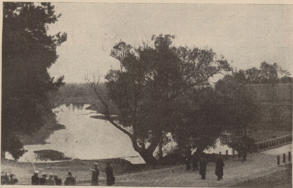
Zulów — widok na staw.

szych lat starała się rozwijać w nich samodzielność myśli, i podniecała poczucie godności osobistej. „Od dnia dzisiejszego“, mówił mówca, „Zulów stanie się miejscem pielgrzymek nowych młodych pokoleń, — staje się początkiem wielkiego szlaku Józefa Piłsudskiego po przez umiłowane Wilno, po przez nadniemeński decydujący bój, po przez trudem i znojem prze-