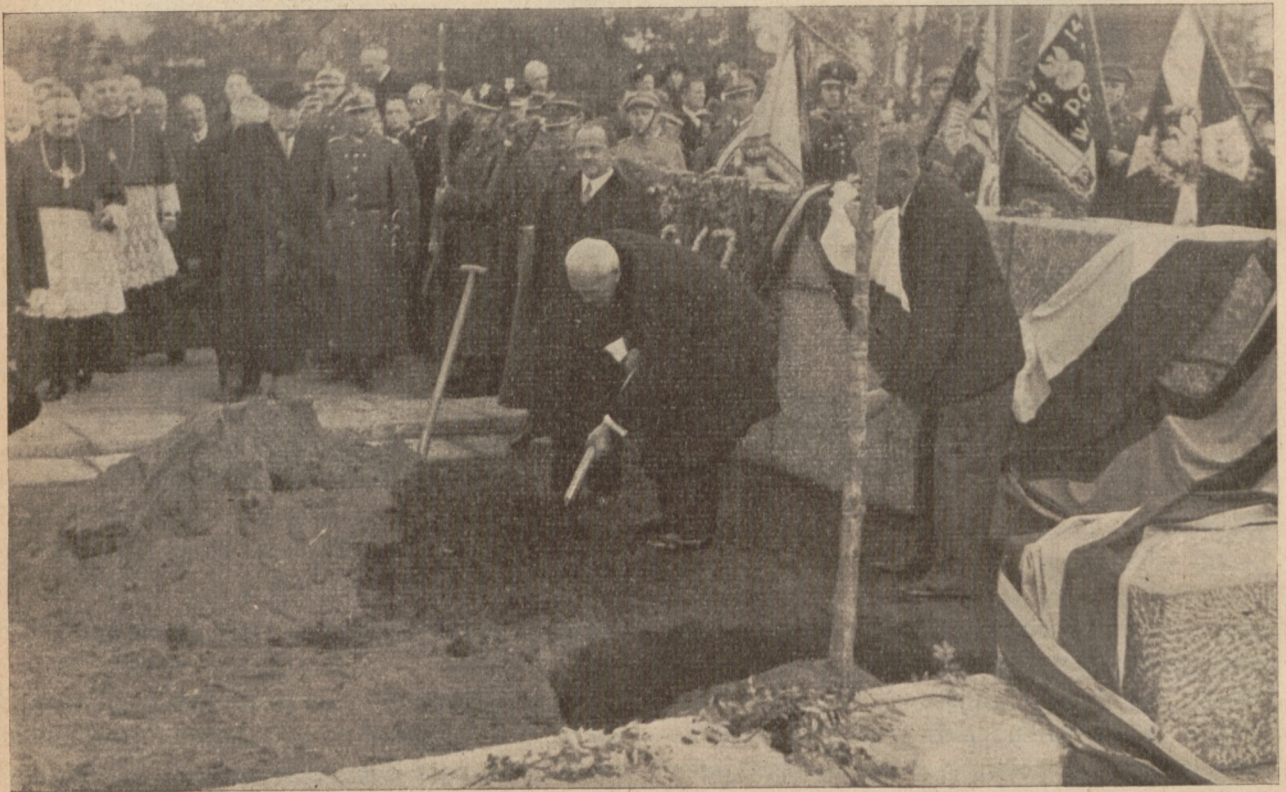
Zułów — Pan Prezydent R. P. dokonywa aktu zasadzenia pamiątkowego dębu.

chał do Bezdán, celem wzięcia udziału w uroczystościach poświęcenia 100 szkół Marszałka Józefa Piłsudskiego.