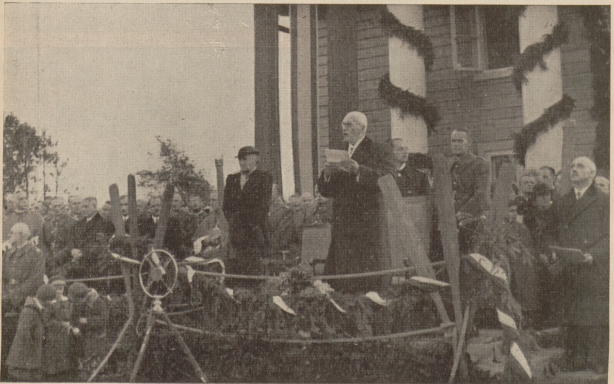
Bezpany — Przemówienie Pana Prezydenta R. P.