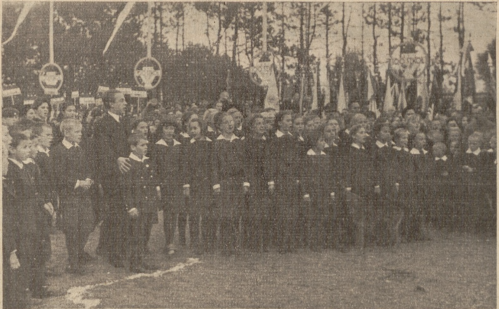
Bezdney — fragment uroczystości — recytacja zbiorowa wiersza „Marszałek i dzieci“ w wykonaniu dzieci szkolnych.

O krótkich, płowych czuprynkach, w starych sukmankach, chuścinkach, gdy w szkolne weszłyście życie.