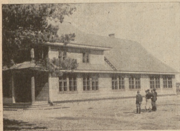
3 kl. Publ. Szkoła Powsz. w N. Werkach, pow. wil-trocki.

Ponadto gminy, które otrzymały budulec z lasów państwowych na kredyt pięcioletni, w ciągu tego okresu będą musiały pokryć swe zobo-