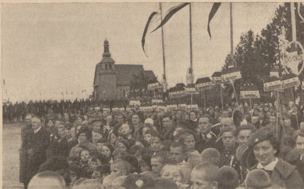
Bezdany — w oczekiwaniu na przyjazd Pana Prezydenta R. P.

wodowych z Wilna, coraz więcej gości napływających od strony Zułowa, po skończonych tam uroczystościach.