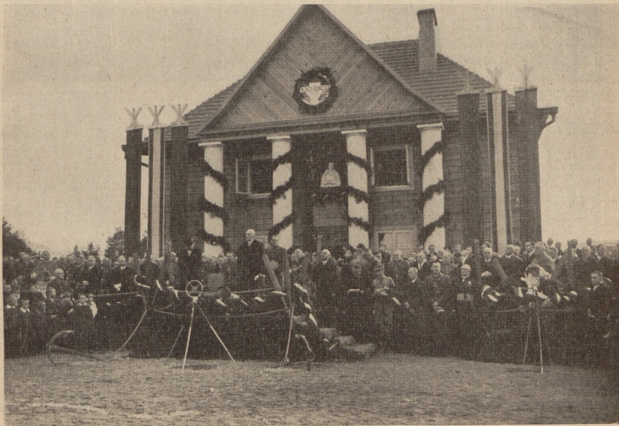
Bezdany — fragment uroczystości — Hymn Narodowy.

Na koniec przemówił przedstawiciel miejscowej ludności, dziękując Panu Prezydentowi za zaszczytowanie Bezdany swą obecnością.