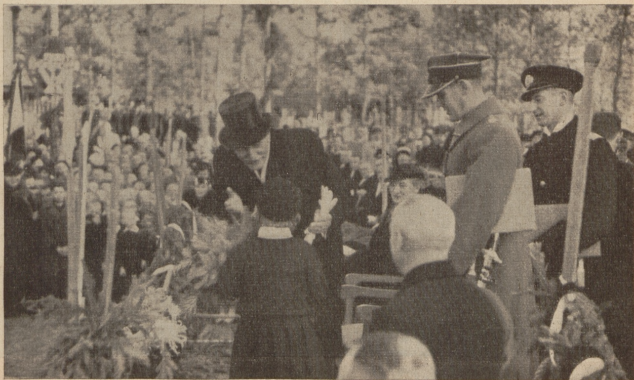
Bezdany — uczennica szkoły powszechnej wręcza Panu Prezydentowi R. P. wiązkę kwiatów.

chwili orkiestra odgrała Hymn narodowy. Delegacja ludności powitała Pana Prezydenta przed bramą triumfalną chlebem i solą. Zgromadzona w szpalerach publiczność wznosiła nieustannie okrzyki na cześć Dostojnego Gościa, który przeszedłszy przed frontem szwadronu ułanów, udał się w stronę kościoła w otoczeniu