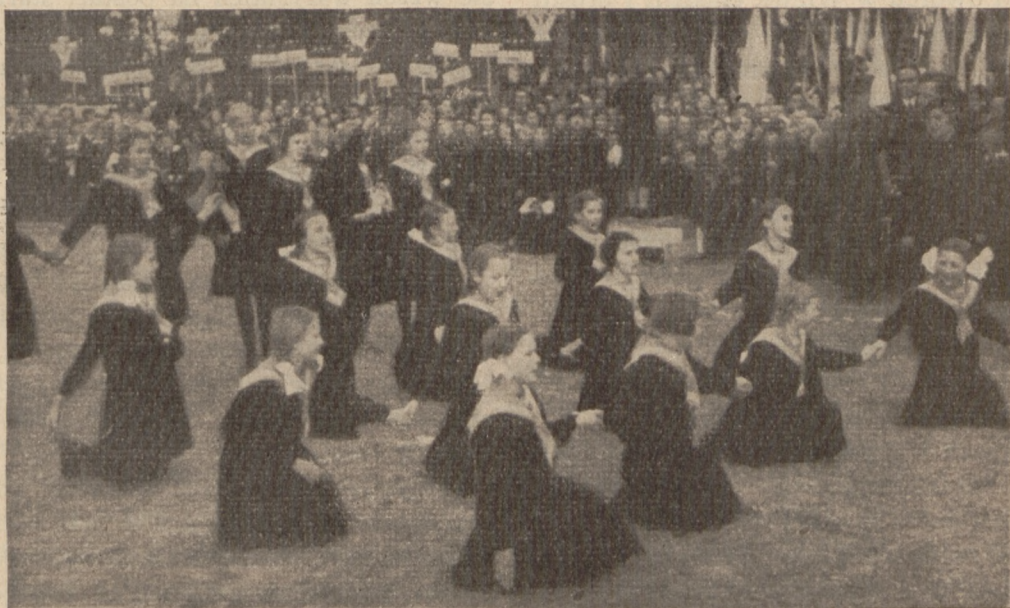
Bezdaný — fragment uroczystości — inscenizacja w wykonaniu dzieci szkolnych.

Panie Prezydencie! W tej chwili dałeś młodzieży i nam wszystkim najpiękniejszą lekcję prawdziwego dostojęstwa i najistotniejszej powagi: nie tej, która musi kryć się za marsowatą