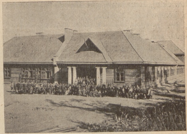
7 kl. Publ. Szkoła Powsz. w Dru, pow. brasławski.

Przy wyborze punktów, w których zdecydowano budowę, uwzględniano dążenie ludności do otrzymania szkoły możliwie wyższego stopnia organizacyjnego, zaspakajającej potrzeby nie tylko własnego rejonu, ale obsługującej też i najniżej zorganizowane szkoły sąsiedzkie, poprawiano istniejącą sieć szkolną, obejmując nią szereg miejscowości dotychczas bezszkolnych, uwzględniano punkty szczególnie ważne ze względów państwowych, przy czym brano pod uwagę przede wszystkim te punkty, które miały najgorsze warunki lokalowe, a nie posiadały widoków na budowę szkoły o własnych siłach. Ogólnym zasadniczym dążeniem było podnie-