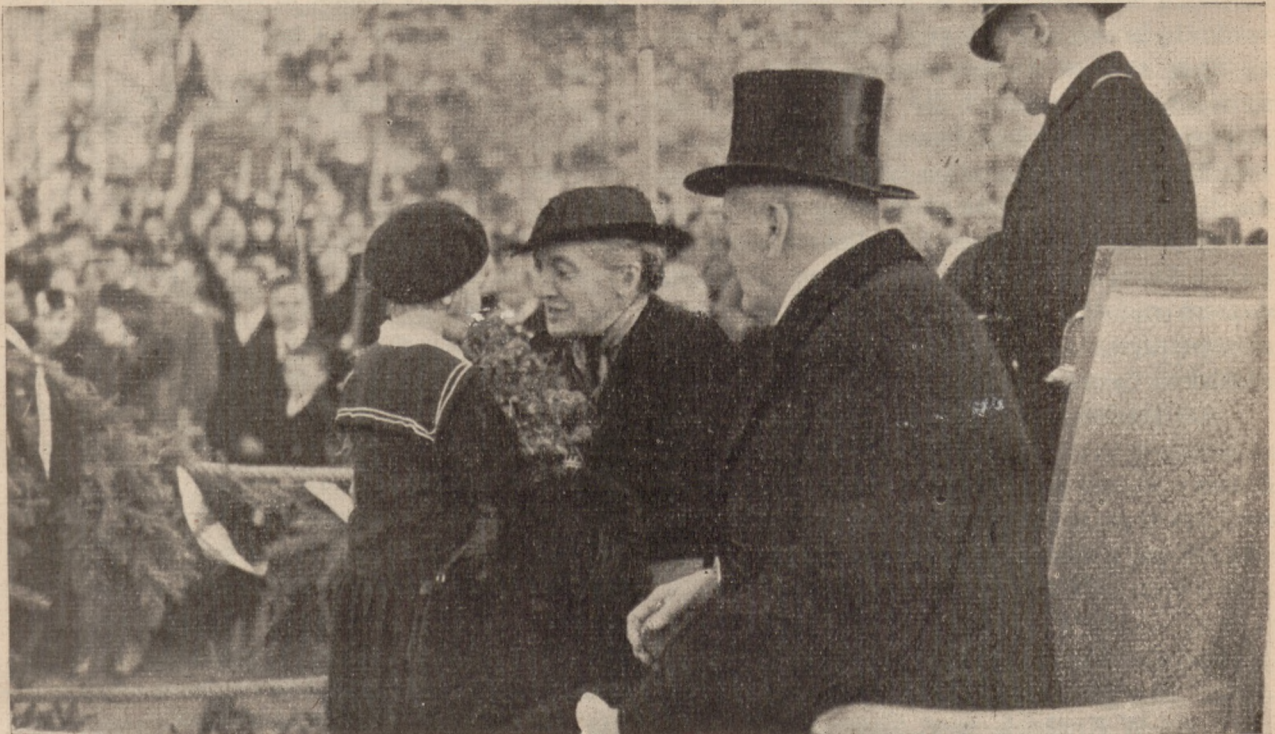
Bezdney — Pani Marszałkowa ciepłym ruchem objęła małą dziewczynkę, która Jej kwiaty podawała.

dziewczynkę, która Jej kwiaty podawała, i coś tam sobie szeptały przez dłuższy czas.