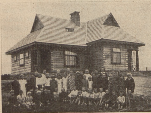
1 kl. Publ. Szkoła Powsz., w Stawrowie pow. brasławski.

W powiecie brasławskim: Stawrowo, gm. bohińskiej, Achremowce, gm. brasławskiej, Druja, Marcinkowice, gm. dryświackiej, Judycyn,