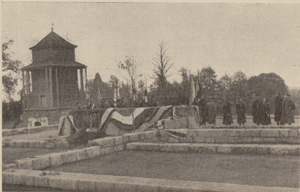
Zulów — zarys fundamentów — miejsce, w którym stała kolebka Marszałka.