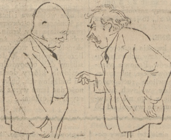
LUTHER (niem. prezyd. ministrów) i BRIAND (franc. min. spraw zagr.) W LOCARNO.

Sama umowa polsko - francuska, stanowiąca specjalny dokument międzynarodowy mówi o wzajemnej gwarancji dobrodziejstw, wypływających z zawartych traktatów, drogą specjalnego traktatu, w ramach Paktu Ligi Narodów. Oba Państwa zobowiązują się do wzajemnej pomocy na podstawie art. 16 Paktu Ligi. Ratyfikacja specjalnej tej umowy ma nastąpić jednocześnie z ratyfikacją całokształtu dokumentów locarneńskich — czem raz jeszcze