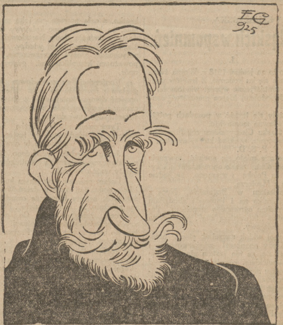
G. B. Shaw (Szou),

światło sławy pisarz dramatyczny, działacz socjalistyczny angielski.