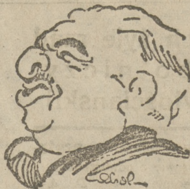
LEON DAUDET (Dode), monarchista francuski, skazany świeżo za oszczerstwo.

2. Listy wyborcze winny być sporządzone systemem mieszanym; dla fabryk zatrudniających od 50 robotników, według miejsca pracy, dla wszystkich innych według miejsca zamieszkania