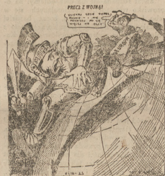
EUROPA PRZEPĘDZA MARSA (boga wojny). — Uciekaj gdzie pieprz rośnie i nie pokazuj mi się więcej na oczy.

Bilety w cenie 50 gr. nabywać można w sekretarjacie W. O. K. R., Al. Jerozolimskie 6, od godz. 10 — 1 i od 5 — 7.