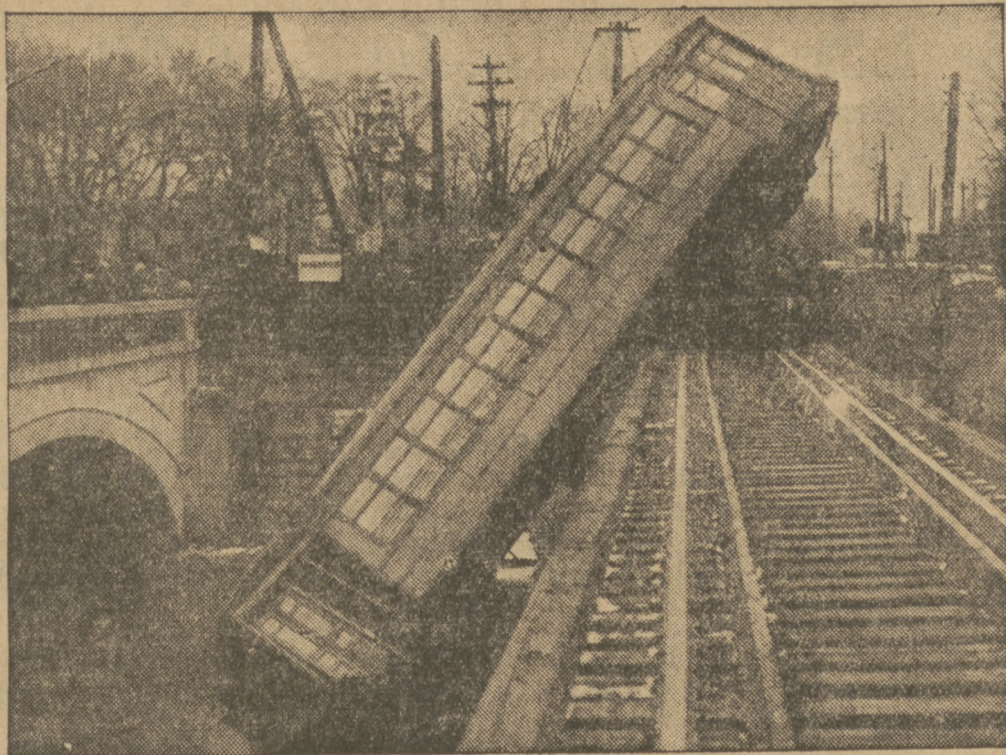
Wykolejenia się tramwaju w Nowym Jorku. Z pasażerów nikt nie zginął.