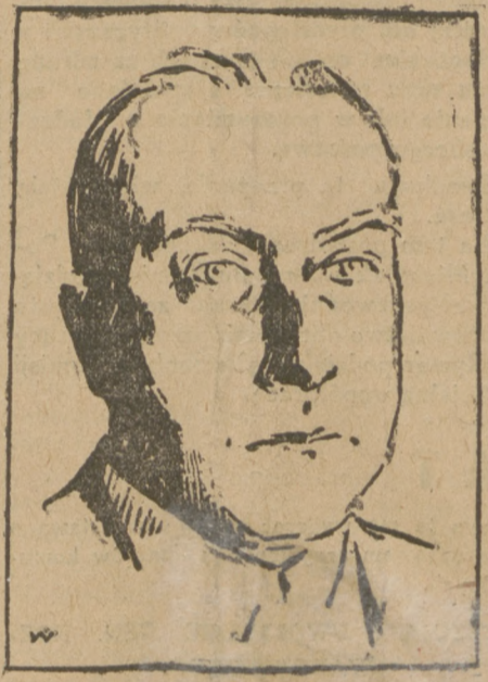
Dr. Curtius, wielki przemysłowiec niemiecki, usiłuje stworzyć prawicowy gabinet w Niemczech.

BERLIN, 12 stycznia (A. W.). Wobec stanowczej odmowy centrum współpracy z niemiecko - narodowymi, misję dr. Curtiusa tworzenia gabinetu należy uważać za nieudaną. Dzisiejsze narady Curtiusa z przywódcami związków zawodowych miały jedynie charakter informacyjny, przyczem jednakże wykazały zasadniczą rozbieżność zdań w rozmaitych sprawach specjalnych, a szczególnie w zakresie czasu pracy, tak, iż porozumienie Curtiusa z socjal - demokratami jest wykluczone. W kołach parlamentarnych liczą się już z możliwością zrzeczenia się przez Curtiusa misji tworzenia gabinetu. Utrzymuje się przekonanie, że jedynie możliwą do zrealizowania kombinacją będzie gabinet środka z poparciem socjalistów. Podobno jednakże dr. Curtius zamierza jeszcze próbować pertraktacji w sprawie gabinetu środka przy oparciu o niemiecko - narodowych. Prasa demokratyczna i lewicowa odnosi się wyraźnie nieprzychylnie do dr. Curtiusa, domagając się złożenia przez niego powierzonej mu misji.