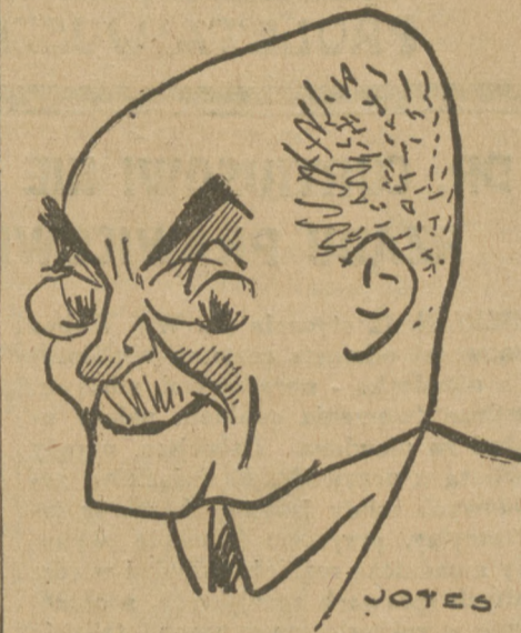
Nowomianowany minister Oświaty SEN. DOBRUCKI

P. minister oświaty Dobrucki pośpieszył z oświadczeniem na łamach „Słowa Polskiego” — lwowskiego organu Zw. L. N., że podejrzenia na wszystkich kół nacjonalistycznych, jakoby on, p. senator, Gustaw Dobrucki był „ukrainofilem”, pozbawione są wszelkiej podstawy.