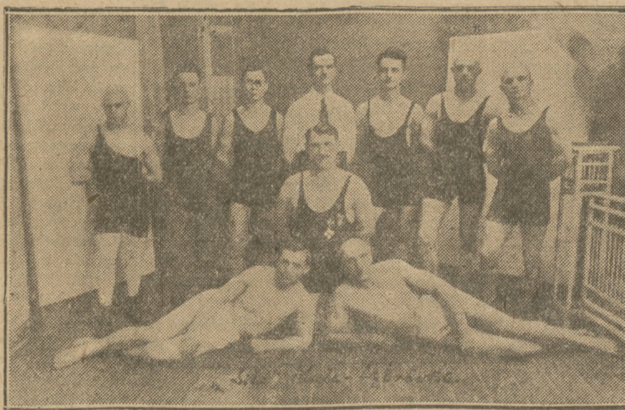
Sekcja ciężko-atletyczna „Siły” (Mała Dąbrówka).

Po ostatnim występie Ł. K. S. w Warszawie nikt nie przypuszczał, iż łodzianie potrafili być groźnym przeciwnikiem dla Wisły. A jednak... Wynik remisowy mówi za siebie.