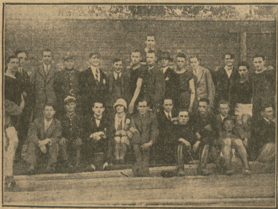
Sekcja lekko-atletyczna Sarmaty.