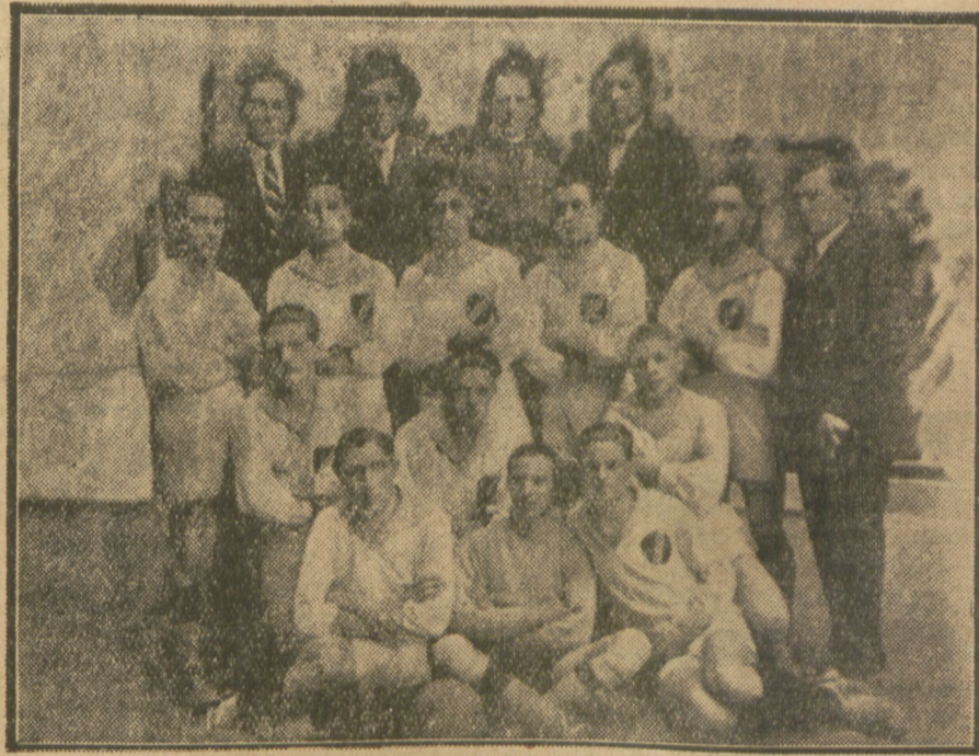
R. K. S. Marymont mistrz kl. A W.R.S.K.O. na rok 1928