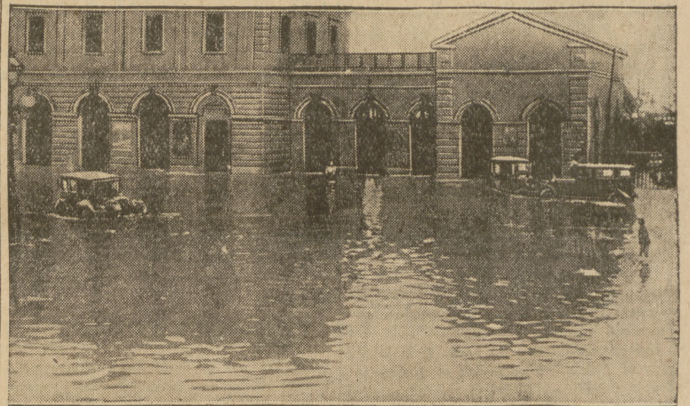
ATENY, STOLICA GRECJI.

gdzie rozpoczyna się w dniu dzisiejszym konferencja w sprawie utworzenia międzynarodowego Banku Reparacyjnego.