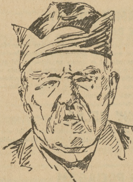
JERZY CLEMENCEAU. nestor francuskich mężów stanu, ostatnio ciężko zaniemógł.

Na konferencji haskiej — jak wiadomo — postanowiono utworzyć międzynarodowy bank reparacyjny. Obecnie toczy się walka o to gdzie ma być siedziba tego banku. Rząd angielski domaga się kategorycznie aby siedziba Banku mieściła się w Londynie. T. zw. amerykański świat finansowy również chętniej widziałby siedzibę tego banku w Londynie niż w jakimkolwiek innym mieście na kontynencie. Ale rządy Francji,