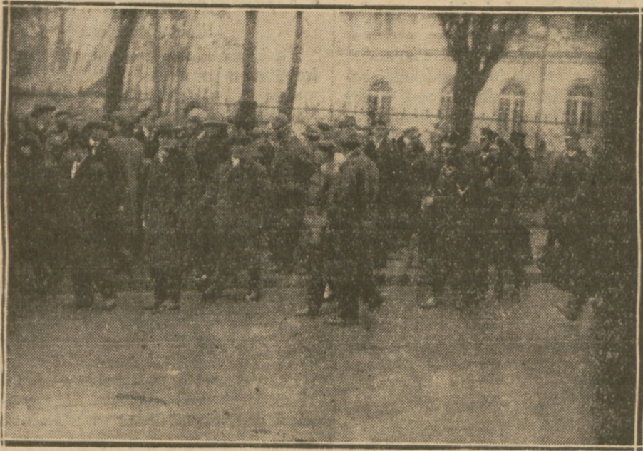
Policja rozpedza tłumy manifestantów.