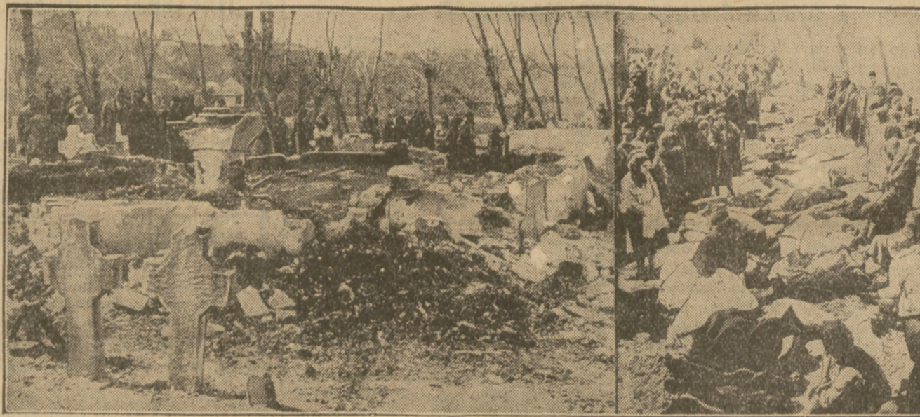
MIEJSCE POŻARU CERKWI W RUMUNJI

gdzie zginęło około 110 osób, przeważnie młodzieży i dzieci. Na ilustracji z lewej strony zgłiszcza kościółka, na prawo zwęglone zwłoki ofiar.