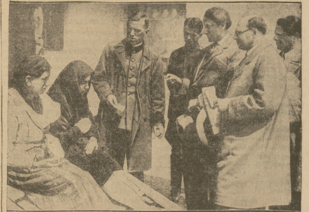
URATOWANE ZE STRASZNEJ KATASTROFY POŻARU CERKWI

gdzie zginęło około 110 osób, przeważnie młodzieży i dzieci. Na ilustracji z lewej strony zgłiszcza kościółka, na prawo zwęglone zwłoki ofiar.