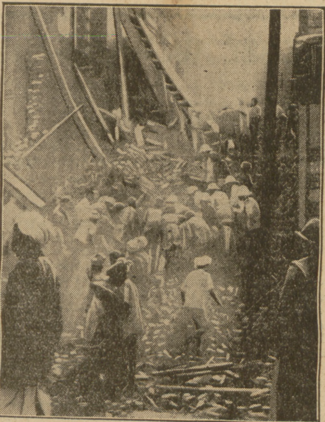
Przed kilku dniami katastrofalne trzęsienie ziemi w Indiach górnych pozoczyło straszne spustoszenia, zamieniając w stopy gruzów wiele miejscowości. Na rycinie obraz spustoszenia w miejscowości Rangoon.