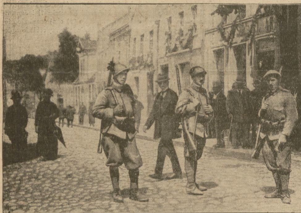
PRZED DZIESIECIU LATY.

Z DOLINY SZWAJCARSKIEJ. W Dolinie Szwajcarskiej dziś, w środę, odbędzie się koncert Orkiestry Filharmonji Warszawskiej, poświęcony muzyce popularnej. Dyryguje p. A. Bronke. Po koncercie odbędzie się rewja p. t. „Pięta przez dziesiąte”.