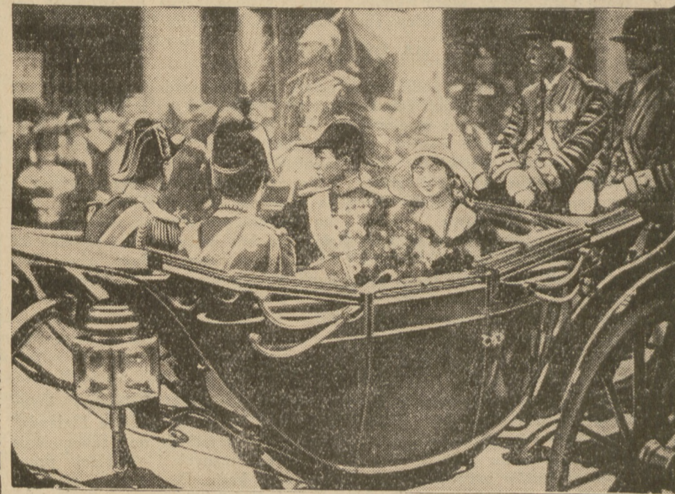
EGZOTYCZNI GOŚCIE W LONDYNIE.

fraktury, istnieje oczywiście jeszcze cały szereg metod, w zasadzie jednak podstawowymi i najsukcesyjniej stosowanymi są tylko te trzy. Która metoda przy leczeniu ma być zastosowana, musi ustalić lekarz na podstawie charakteru złamania kości. Każda fraktura wymaga odrębnego sposobu leczenia, a doświadczony chirurg zawsze będzie wiedział, której metodzie należy dać w danym wypadku pierwszeństwo. Doświadczony chirurg zgóry też przewidzieć może, jak długo leczenie powinno potrwać i jaki będzie miał przebieg i jakim skończy się wynikiem.