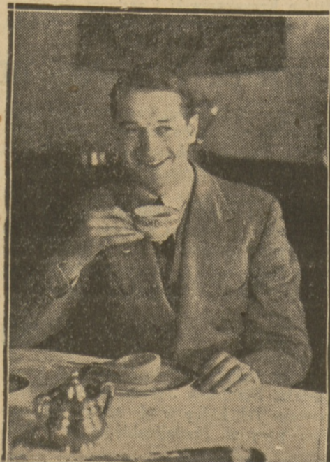
CHEVALIER śmieje się zawsze i wszędzie.

Wytwórnia amerykańska Foxa nosi się obecnie z zamiarem przeróbek na ekran najlepszych dzieł powieściowych i komedjowych pisarzy europejskich, przyczem utwory te mają być produkowane w językach, w jakich zostały napisane. Jeżeli projekt tego rodzaju zostanie rzeczywiście zrealizowany, podniesie to w sposób nadzwyczajny popularność filmów dźwiękowych i znacznie udostępni dźwiękowce szerszemu kołu publiczności.