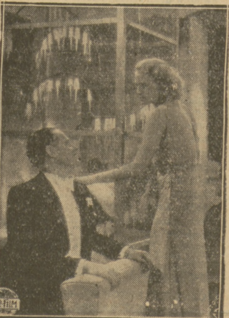
BRYGIDA HELM I JAN KIEPURA w filmie „Neapol, śpiewające miasto”.