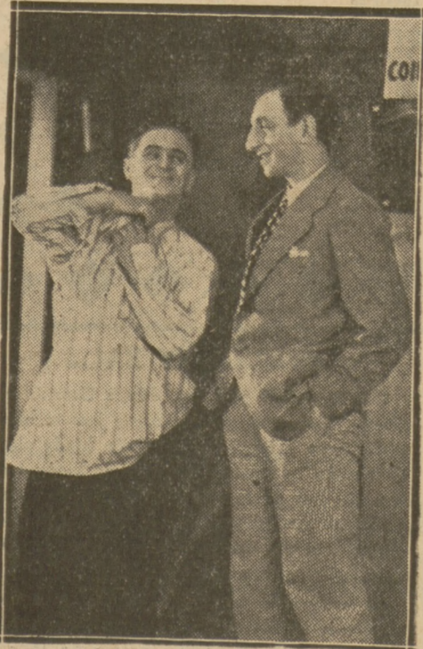
KRUKOWSKI I DYMŚA w polskim dźwiękowcu „Janko Muzykant”.