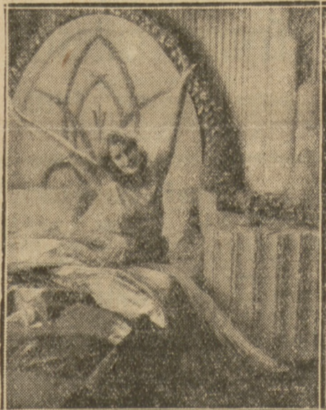
UROCZA BOHATERKA MONTE CARLO

Zawody hokeyowe w Krynicy zostały sfilmowane przez wytwórnię Foxa, która włączy ten film do swego tygodnika dźwiękowego rozsyłanego na cały świat.