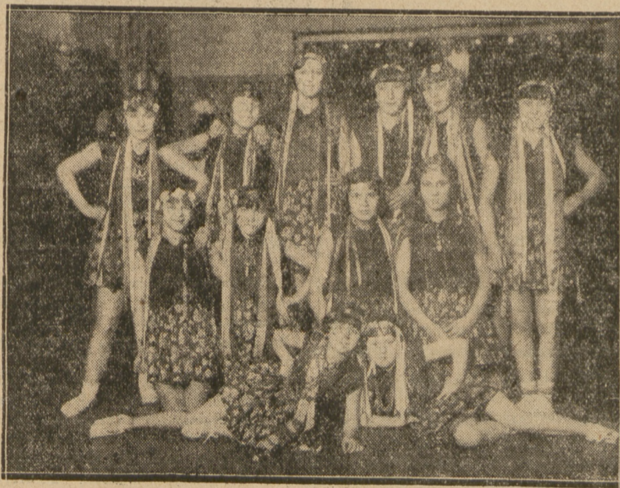
Zespół taneczny sekcji dziecięcej R. K. S. Skry.

Program rozpoczęto odśpiewaniem przez chór męski całego szeregu pieśni. Następnie odbyły się pokazowe walki w ciężkiej atletyce. W dalszym ciągu odbyła się gimnastyka kobieca i wreszcie tańce i plastyka w wykonaniu sekcji dziecięcej Skry. Ten ostatni punkt zwłaszcza był bardzo gorąco przyjęty przez widzów. Na zakończenie chór mieszany odśpiewał „Czerwony Sztandar”.