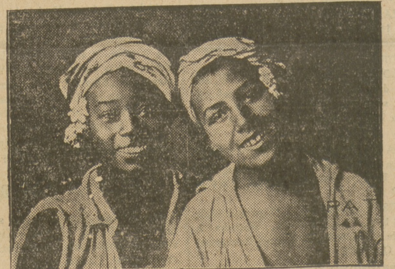
Typowe marokańskie łobuziaki z Algieru w Afryce.