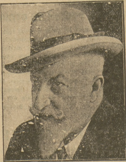
B. KRÓL BUŁGARSKI FERDYNAND.