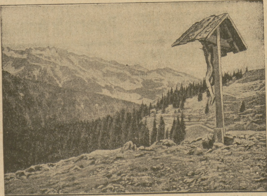
Prześliczny widok z Jaufenpass, niedaleko Meranu w Południowym Tyrolu.