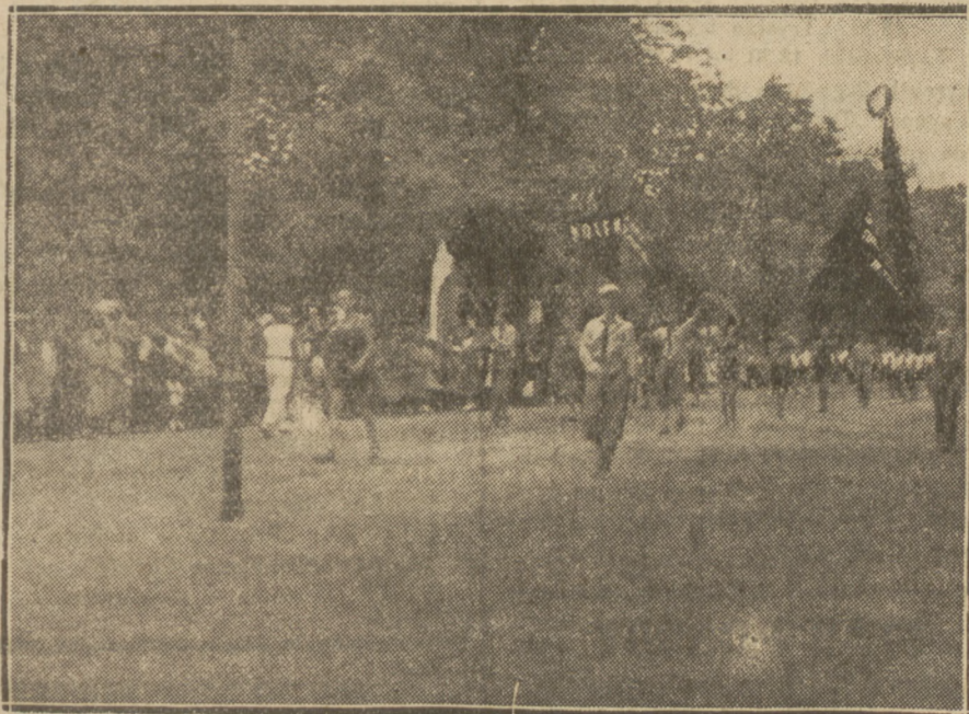
Czoło polskiej grupy olimpijskiej w pochodzie z tow. Michałowiczem na czele