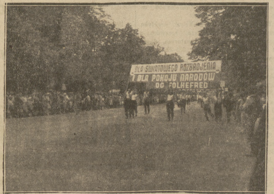
Transparent niesiony w pochodzie olimpijskim przez Jutrznę na Preterze

WARUNKI PRENUMERATY: w Warszawie z odnośnieniem miesięcznie zł. 5.40, bez odnośnienia zł. 4.70, na prowincji miesięcznie zł. 5.40, zagranicą zł. 8.—. Za zmianę adresu 50 gr. CENY OGŁOSZEŃ: Za wiersz wysokości 1 milimetra w tekście gr. 50, zwyczajnie gr. 20, komunikaty i nadesłane gr. 80, nekrologi do 60 mm. gr. 20, powyżej 60 mm. gr. 30, drobne za wyraz gr. 20. Poszukiwanie i zaofiarowanie pracy bezpłatnie. Ogłoszenia tabelaryczne o 50 proc. drożej. Ogłoszenia zagraniczne o 50 proc. drożej. Układ ogłoszeń w tekście 5-szpaltowy, układ zwyczajnych — 10-szpaltowy. Za terminowy druk ogłoszeń Administracja nie odpowiada.