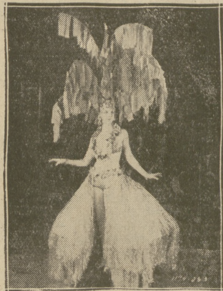
STYLIZOWANY KOSTJUM stylu „Pompadour” z rewji Paramount.