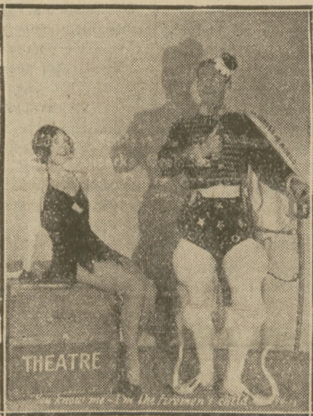
BOHATERZY FILMU Paramount p. t. „Artyści”.

Wytwórnia Slinks ma przystąpić podobno do produkcji nowego filmu z historii powstania Legionów. Scenariusz opracował znowu p. Sieroszewski.