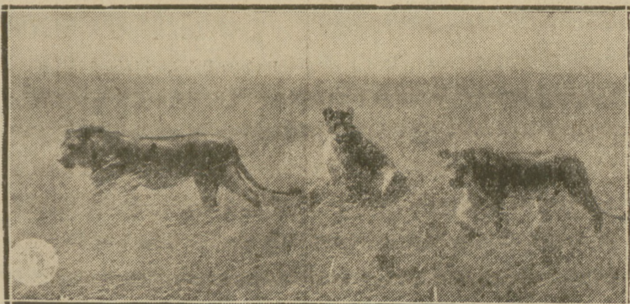
Z FILMU „AFRYKA MÓWI”.

WARUNKI PRENUMERATY: w Warszawie z odnośnieniem miesięcznie zł. 5.40, bez odnośnienia zł. 4.70, na prowincji miesięcznie zł. 5.40, zagranicą zł. 8.—. Za zmianę adresu 50 gr. CENY OGŁOSZEŃ: Za wiersz wysokości 1 milimetra w tekście gr. 50, zwyczajnie gr. 20, komunikaty i nadesłane gr. 80, nekrologi do 60 mm. gr. 20, powyżej 60 mm. gr. 30, drobne za wyraz gr. 20. Poszukiwanie i zaofiarowanie pracy bezpłatnie. Ogłoszenia tabelaryczne o 50 proc. drożej. Ogłoszenia zagraniczne o 50 proc. drożej. Układ ogłoszeń w tekście 5-szpaltowy, układ zwyczajnych — 10-szpaltowy. Za terminowy druk ogłoszeń Administracja nie odpowiada.