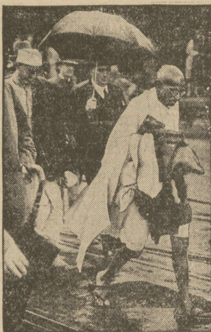
spaceruje w narodowym stroju Hindusów.