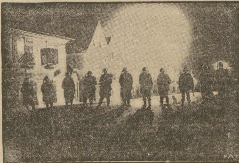
Oddział żołnierzy austriackich, pełniący straż na ulicy miasteczka KINDSBERG w Styrii, po zlikwidowaniu „rządów” Heimwehry w tem mieście.