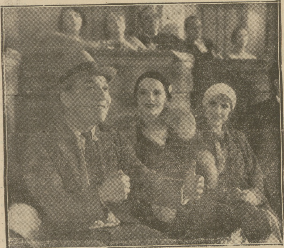
SCENA Z FILMU „KRÓL BULWARÓW”, który ukaże się dz.ś w „Majesticu”.