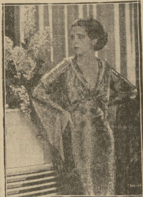
NOWA AKTORKA PARAMOUNT.

Jak dotąd, dział filmów dla dzieci jest specjalnie zaniedbany i niedoceniany, to też z radością należy powitać powstanie niemieckiej wytwórni w Monachjum, która zamierza produkować jedynie tylko filmy dla dzieci i to osnute na tle bajek. Brak filmów tego typu dawał się, jak dotąd, bardzo odczuwać, więc też produkcja ta może liczyć na pewne powodzenie.