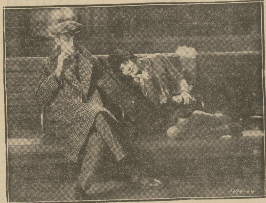
TAKIE SCENKI ZDARZAJĄ SIĘ CZĘSTO W HOLLYWOOD, gdzie panuje bezrobocie wśród aktorów.