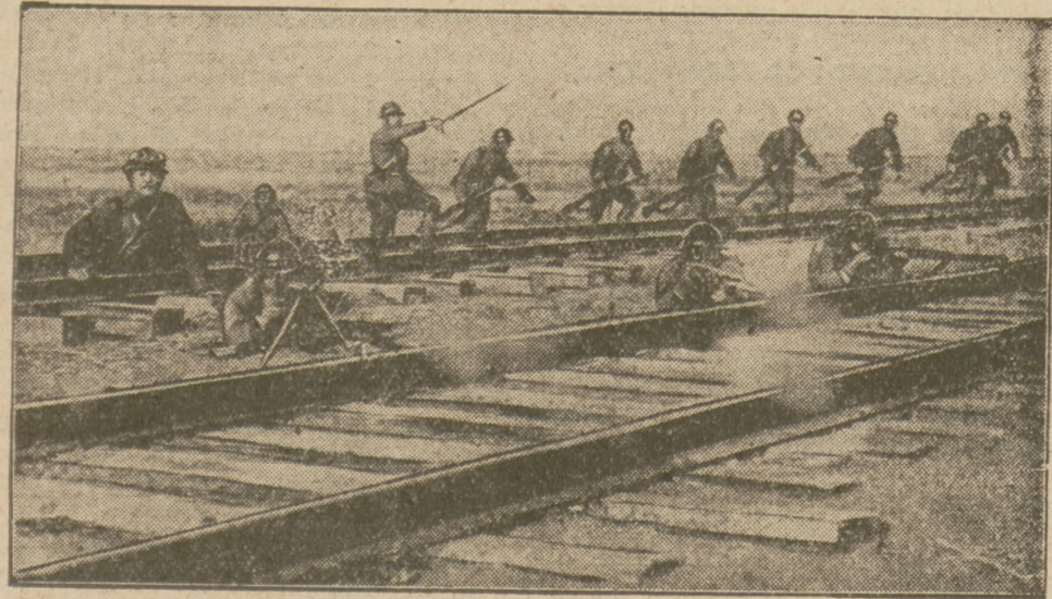
WALKI O KOLEJ WSCHODNIO-CHIŃSKĄ. ATAK WOJSK JAPONSKICH NA POZYCJE CHIŃSKIE.