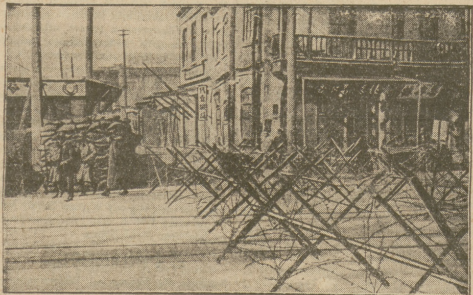
W TIEN-TSINIE ZASIEKI Z DRUTU KOLCZASTEGO BRONIĄ DZIELNIC EUROPEJSKIEJ I JAPONSKIEJ.