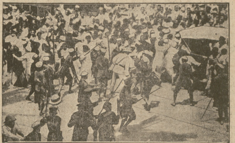
Pierwsze oryginalne zdjęcie z terenu angielska rozpędza tłum demonstrujących na cześć Gandhiego.