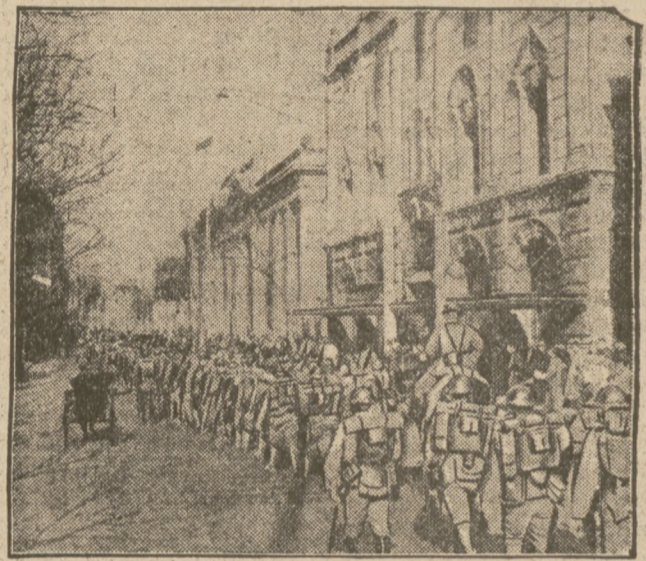
Wojska chińskie przygotowują się do obrony Tien-Tsinu. Do miasta przybijają wciąż nowe pułki ze wszystkich dzielnic Chin.