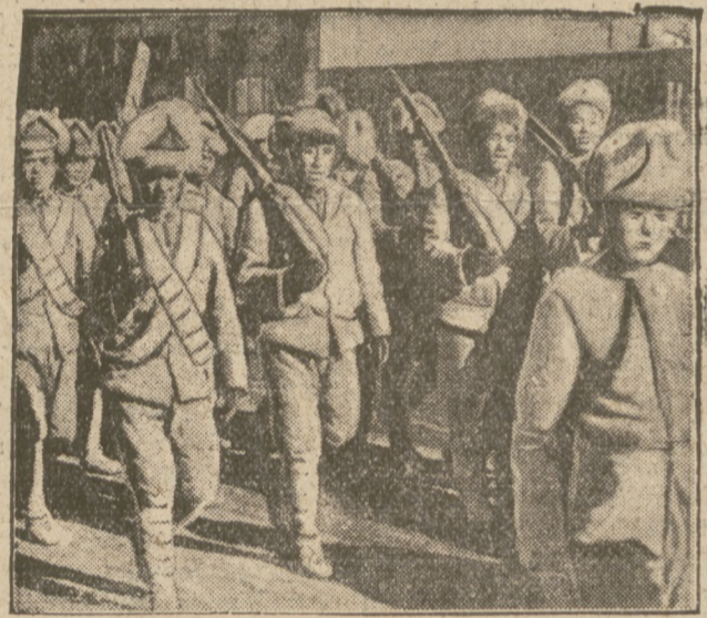
Oddziały chińskie opuszczają Kin-Tchau po krwawej bitwie z Japończykami.