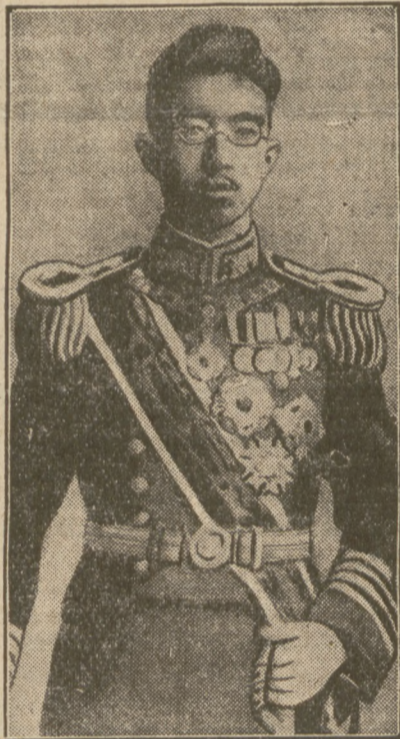
Cesarz Japonji Hirohito, na którego dokonano przed kilkoma dniami zamachu bombowego.

ku przybywa na Zlot T. U. R-a do Poremby, aż nieubłagana śmierć kładzie kres ofiarnemu życiu.