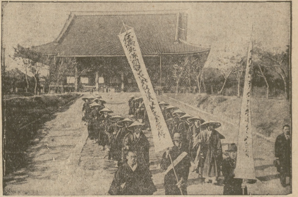
Wmarsz oddziałów japońskich do jednego z miast Mandzurji.