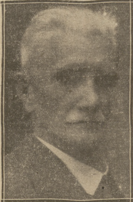
IGNACY DASZYŃSKI, założyciel i prezes T. U. R.