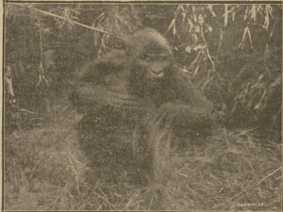
Goryl - małpud jest bohaterem filmu „Congorilla” ukazującego niebada ne ziemie Konga w sercu Afryki.

królewski lew, wiotka żyrafa, wiatronoga zebra i wreszcie najrozszy zwierzę dżungli — goryl. Cudaoczny szczer czarnoskórych pigmejów, żyjących w kniei, jak w rajku bliższym, przetańczył przed nimi swe obrzędy i obyczaje. To, co stanowi o nieporównanej wartości filmu „Congorilla”, to fakt, że wszystkie jego dźwięki zostały zarejestrowane na miejscu, w pełni Konga belgijskiego.