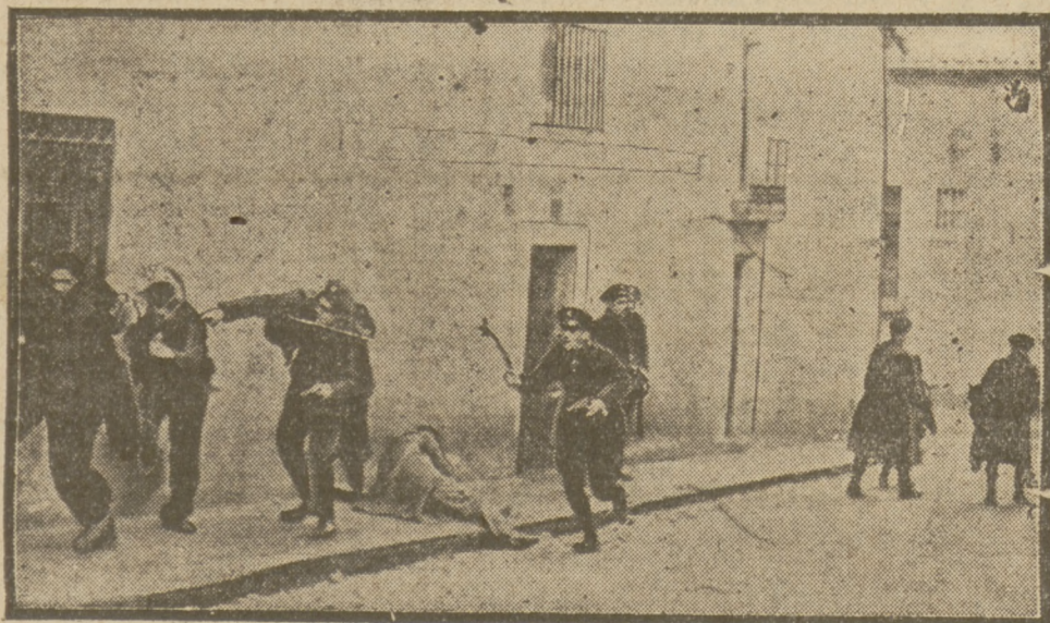
W Salamance syndykaliści proklamowali strajk generalny. W czasie zaburzeń doszło do starć z policją.