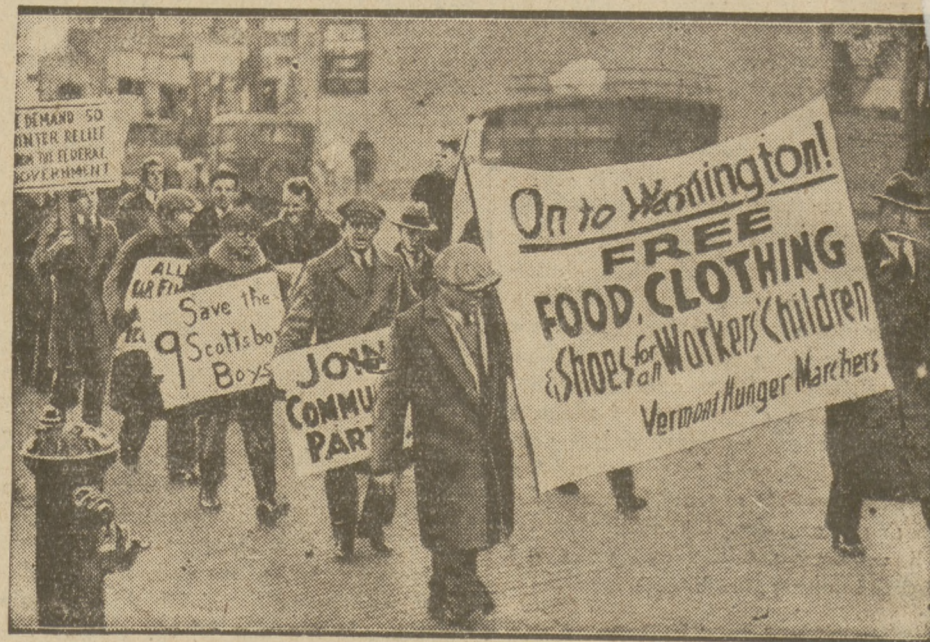
Na zdjęciu naszym widzimy czoło nowego pochodu głodnych, maszerujących na Waszyngton.

Rozkoszna Anny Ondra i słynny reżyser Karol Lamacz po raz pierwszy razem na ekranie w wielkim czeskim filmie dźwiękowym „ Raj podlotków ” już jutro w kinie „ PALACE ”