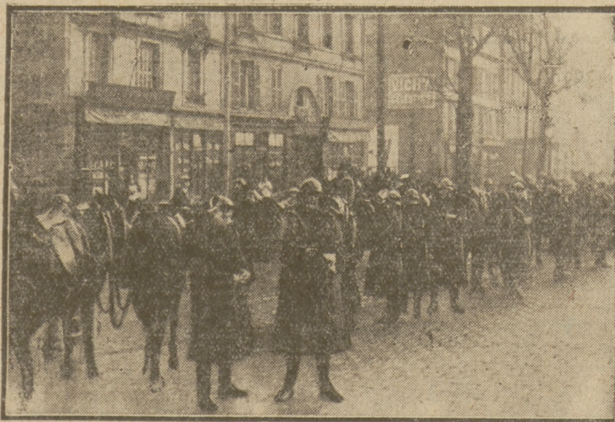
Na ulicach Hawru, gdzie wybuchł strajk robotników portowych, władze sprowadziły wojsko, celem utrzymania „porządku”.