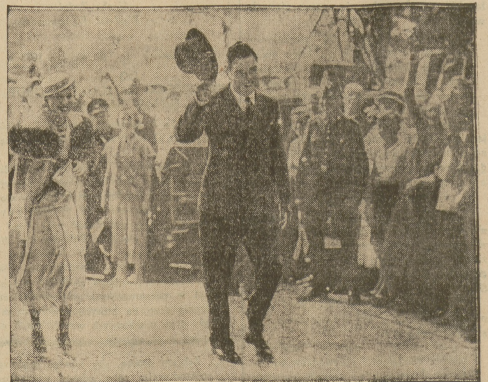
W Berlinie odbył się ślub b. bokse rskiego mistrza świata Schmelonga ze słynną aktorką ozeską Anny Ondra.