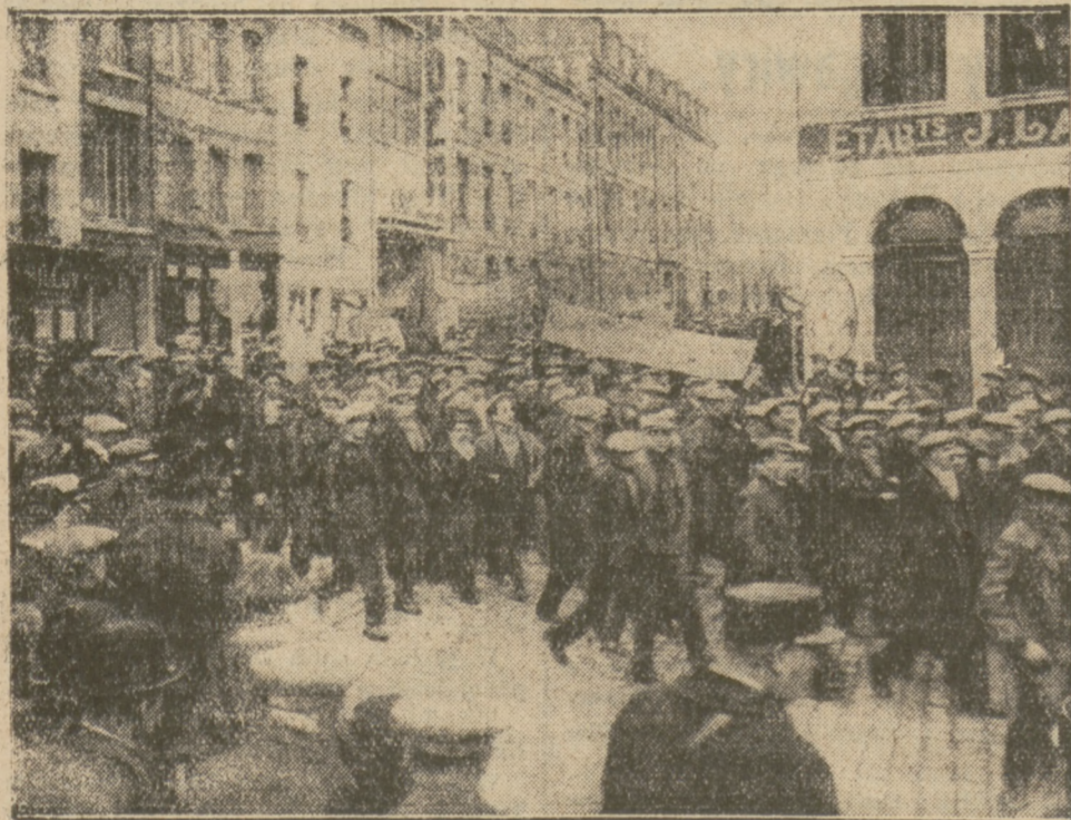
FRAGMENT Z POCHODU BEZROBOTNYCH GÓRNIKÓW NA PARYŻ.

Pochód głodnych wywołał olbrzymie wrażenie w całej Francji, zwłaszcza, że związki zapowiadają, że to jest dopiero „pierwszy akt”.