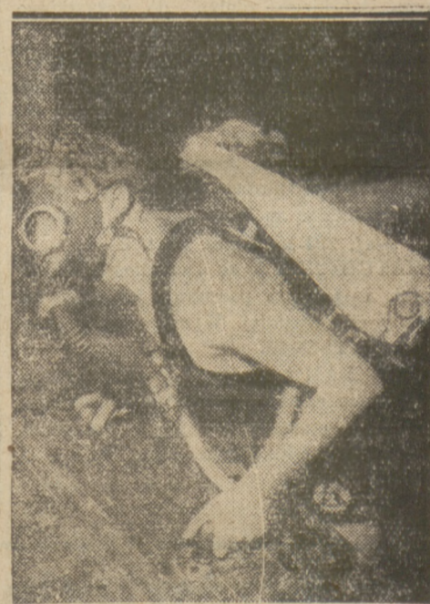
który pozwala nurkowi na pełną swobodę ruchów pod wodą.