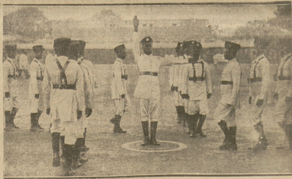
W Bombaju inspektor policji hinduskiej wykłada swoim podwładnym przepisy o ruchu ulicznym.