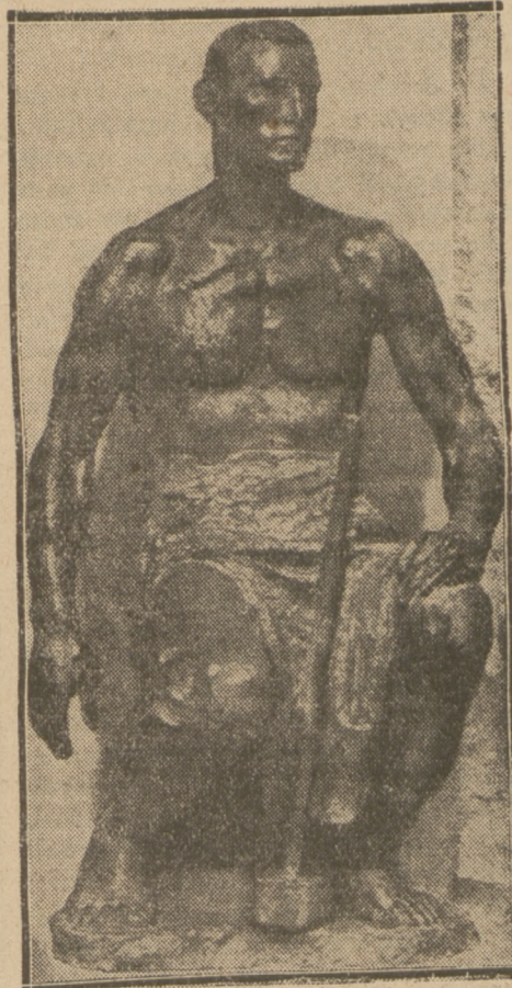
KOWAL. Rzeźba znakomitego rzeźbiarza belgijskiego Meuniera.