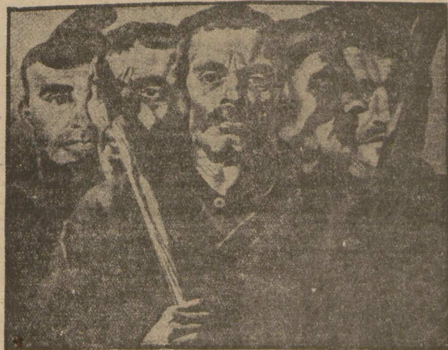
„ROBOTNICZY”, obraz malarki holenderskiej Charley Toorops.

*) czytają: Lurd, miejscowość we Francji, słynąca z „cudów”.