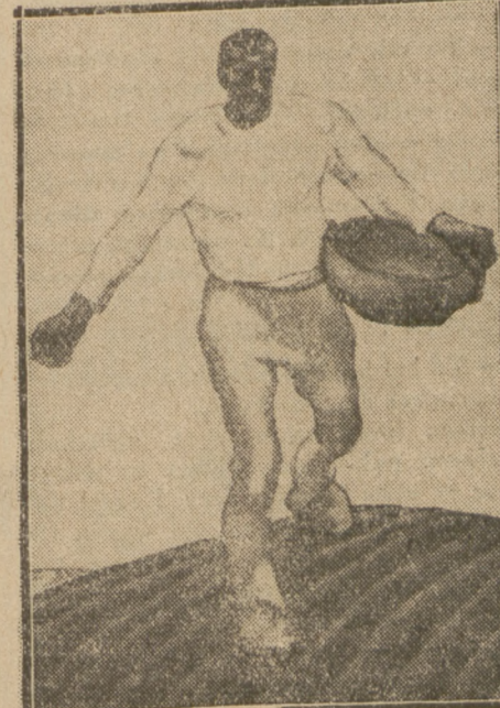
SIEWCA. Obraz malarza szwajcarskiego Egger-Lienza.