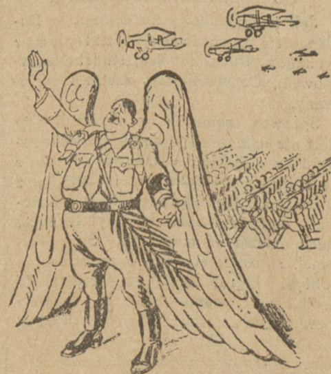
HITLER JAKO „ANIOŁ POKOJU”