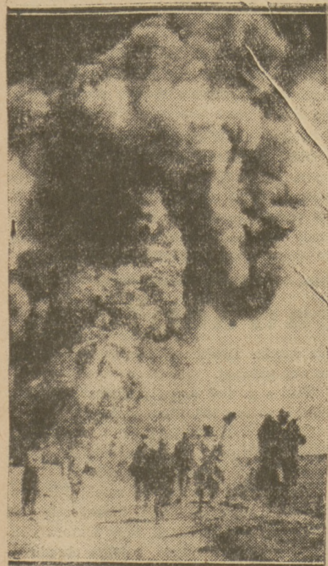
PŁONĄCE SZYBY NAFTOWE W MAROKKU.

Dostęp do miejsca katastrofy jest zupełnie niemożliwy, gdyż pożar w kopalni trwa dotychczas; i może trwać całe lata.