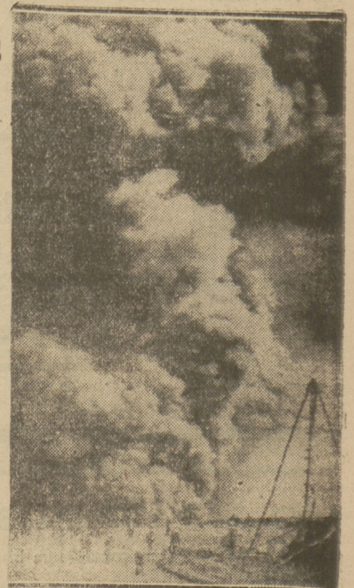
PALĄCE SIĘ SZYBY NAFTOWE W AMERYCE.

Palące się pole piaskowe jest świętem miejscem wycieczek religijnych dla Parsów, którzy jak wiadomo głównie mieszkają w Kalkucie w Indiach Angielskich. Oni dają co rok odpowiednią sumę pieniędzy, potrzebną na utrzymanie świątyni i kapłanów w pobliżu „świętego piasku”, gdzie czci się „święty ogień”.