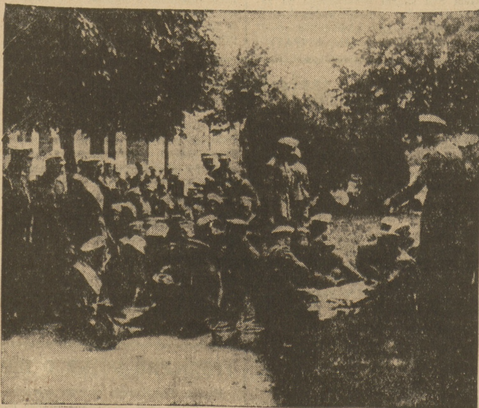
NA PLACACH I ULICACH SOFJI

Ta wersja spotyka się z zastrzeżeniami ze strony zwolenników Cankowa. Ci ostatni twierdzą, że przygotowania do przewrotu trwały pół roku, a historyjka o przygotowanym puczu była pretekstem do rozwiązania wszystkich stronnictw.