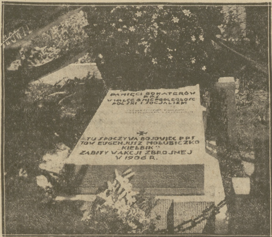
PŁYTA PAMIĄTKOWA NA CMENIARZU.

Uroczystość zakończono podniosłym okrzykiem: „Cześć bohaterom i niech żyje Socjalizm” — co zebrani trzykrotnie powtórzyli, a orkiestra odegrała „Czerwony Sztandar”.