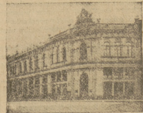
Gmach własny K. K. O. (ul. Zgoda Nr. 7).

Rozwój rzemiosł, popieranie inwestycji w gospodarstwach drobnych, zakładanie sadów i zakup inwentarza, wreszcie budowa i rozbudowa wsi i letnisk — znalazły ze strony K. K. O. gorliwego oredowania. Rozmiar akcji kredytowej K. K. O. w okresie ubiegłego sześciolecia ilustruje fakt udzielenia materialem, na ogólną kwotę zł.