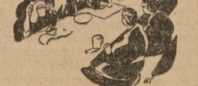
GŁOŚNIKI W ZAKŁADACH PRZEMYSŁOWYCH.

Fabrykanci chcą używać radja jako środka do zwiększenia wydajności pracy. Nie należy jednak traktować tych pobożnych życzeń poważnie, gdyż jesteśmy od tych metod pracy, jakie stosuje Ford czy Rząd Sowiecki, wymagający od robotnika stu procentowej wydajności. U nas wciąż jeszcze pracuje się po dwa lub trzy dni w tygodniu i zazwyczaj niemię, tak wiele roboty, aby muzyka trzeba było zwiększać wydajność rąk ludzkich. Nie ulega natomiast najmniejszej wątpliwości, że każda praca, a szczególnie jednostajny wysiłek wpływa ujemnie na zdrowie człowieka i wyniszcza organizm, przetypia nerwy i t. p. Dlatego też wskazane jest umieszczenie głośników radiowych w jadłodajniach fabrycznych, salach wypoczynkowych, bibliotekach. Muzyka napewno nie zaszkodził zmęczonym mięśniom i stępszonym nerwom robotnika.