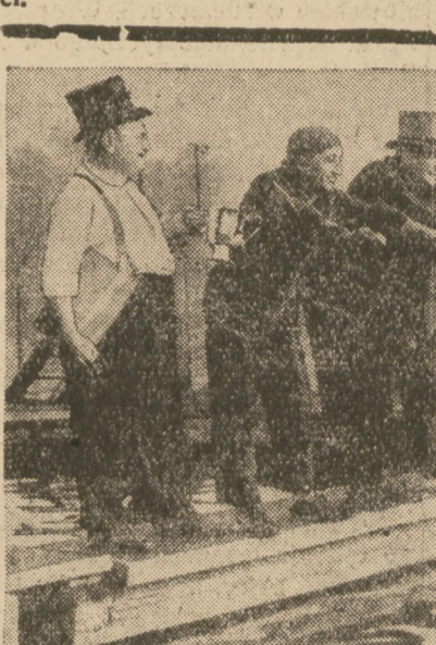
Rok rocznie odbywają się w londyńskim Hyde Parku oryginalne zawody pływackie, w których uczestnicy muszą być w ubraniach. Zdobywca pierwszego miejsca otrzymuje z rąk organizatora tych zawodów, piękną puchar. Zdjęcie nasze przedstawia moment startu 7-u zawodników.

Wrogie nastroje ludności hiszpańskiej wobec faszystowskich władców w tych częściach kraju, które znajdują się pod okupacją wojsk powstańczych rosą.