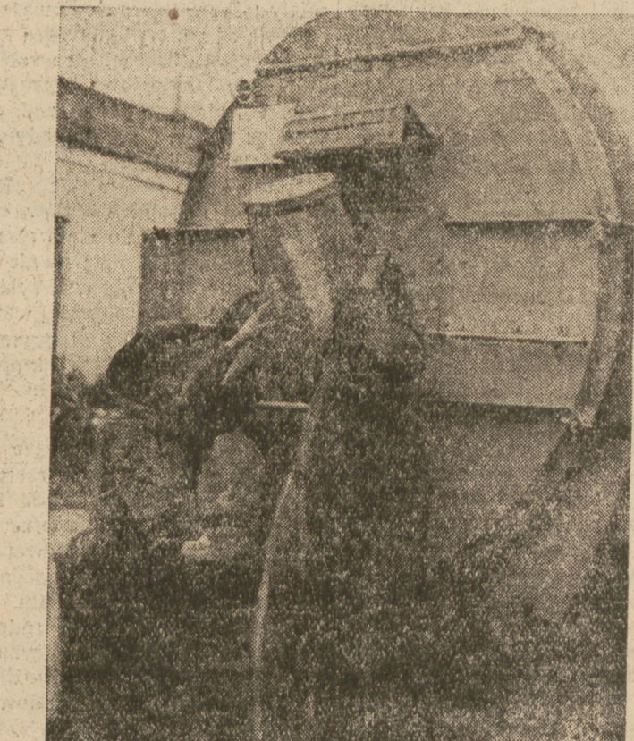
W ostatnich czasach Zarząd Miasta Warszawy wydał blisko pół miliona złotych na zakup specjalnie skonstruowanych kubbów do zbiórki śmieci, oraz trzy hermetyczne wozy, do których wrzucano śmiecie podczas objazdu po Warszawie. Zdjęcie przedstawia moment, gdy śmiecie z kubbów są wrzucane do takiego nowego wozu.