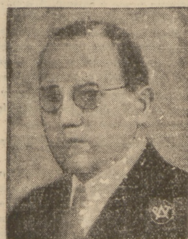
PIERWSZY POSEŁ LITEWSKI W WARSZAWIE, PLK. SKIRPA.

Po podpisaniu w dniu wczorajszym porozumienia polsko-litewskiego nastąpi obecnie uruchomienie bezpośredniej łączności między Warszawą a Kownem na poszczególnych odcinkach.