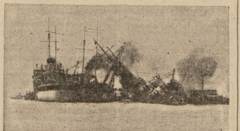
Fragment bitwy morskiej japońsko-chińskiej na południowych wodach chińskich. Jedna z chińskich kanonierek tonie, trafiona torpedą japońską.