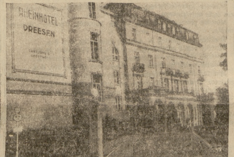
HOTEL „DREESEN” W GODESBURGU, GDZIE ROZPOCZĘŁY SIĘ ROZMOWY CHAMBERLAINA Z HITLEREM.

oceniać na podstawie przyjętych zwyczajów międzynarodowych. „Berliner Boersen Ztg.” stwierdza: Droga Niemiec jest jasna i prosta. Zle sklejony budynek praskiego państwa