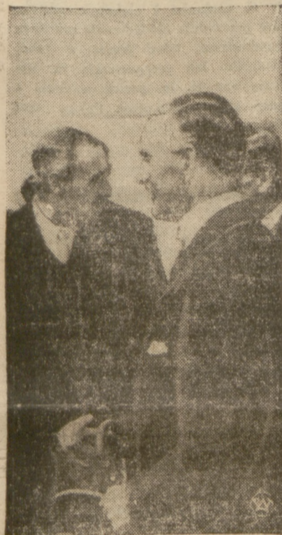
CHAMBERLAIN W NIEMCZECH.

PAT donosi za Reuterem z Godesbergu: BRYTYJSKA DELEGACJA OFICJALNIE OGŁOSIŁA, ŻE ROZMOWA, KTÓRA MIAŁA SIĘ ODBYĆ WCZORAJ RANO POMIĘDZY CHAMBERLAINEM I HITLEREM ZOSTAŁA PRZEZ PREMIERA