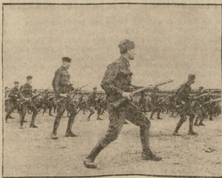
ODDZIAŁ WOJSK CZESKICH W SUDETACH.

Niemieckie biuro informacyjne donosi: Miejscowości, położone na obszarze Sudetów — Niederaders Bach, Weckelsdorf, Liebenau i Untermichelsdorf zostały w czwartek zajęte przez legion sudecki. W piątek rano zjawili się u władz sudeckich oficer czeski, żądając opuszczenia zajętych miejscowości i grożąc w przeciwnym razie zombardowaniem ich przez artylerię. Ponieważ siły legionu sudeckiego były zbyt słabe — wycofały się na terytorium niemieckie, po czym miejscowości te zajęli Czesi.